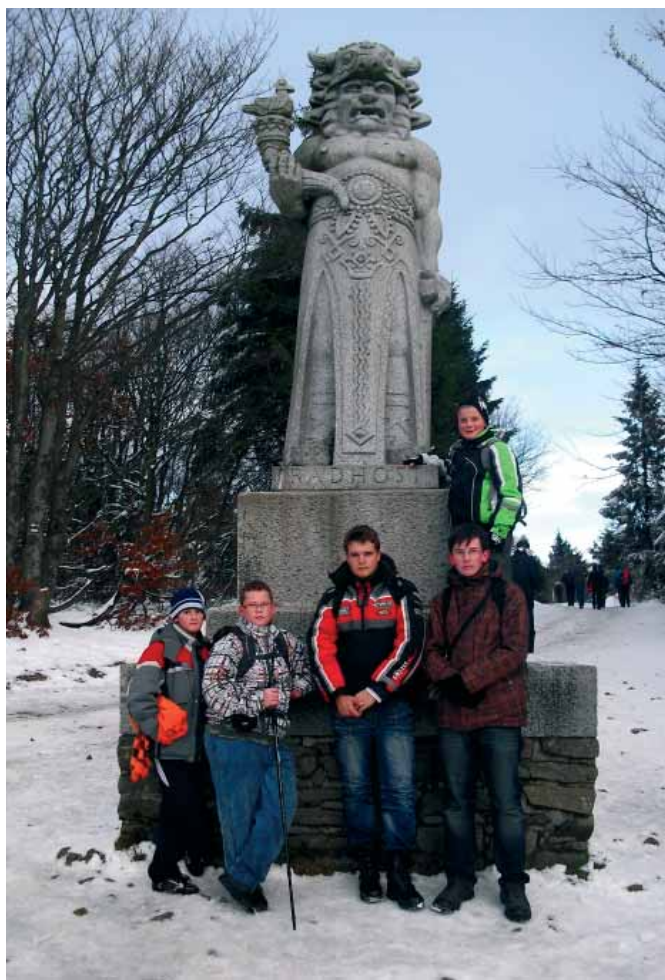
U sochy Radegasta narazili skauti na první snůh.