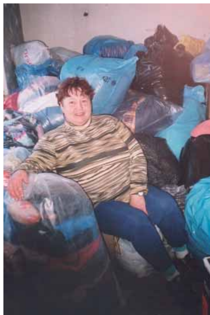
Charitativní sbírka byla úspěšná