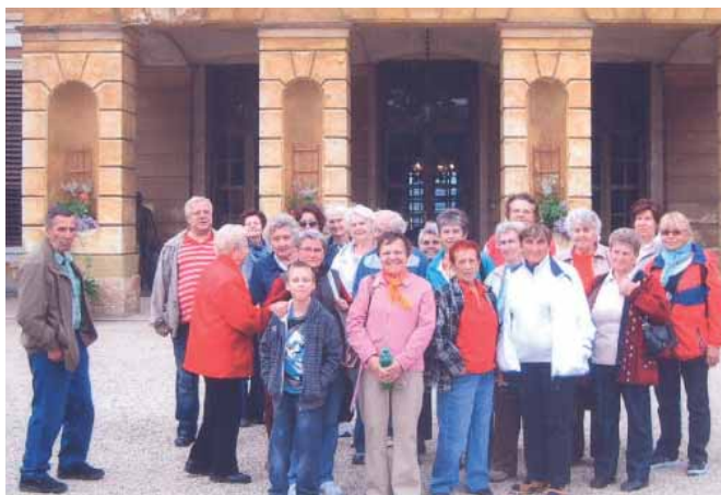
Klub důchodců na zájezdě