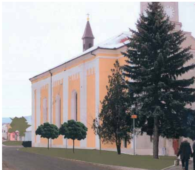
Podoba nové výsadby u kostela Vizualizace: Obec Vranovice

Čtyři vzrostlé lípy u kostela jsou nebezpečné pro své okolí. Jejich zdravotní stav je natolik špatný, že hrozí vyvrácení stromů. Oborníci doporučují jejich skácení. Dojde k němu už v tomto období vegetačního klidu. Nahradí je však nová vhodnější výsadba.