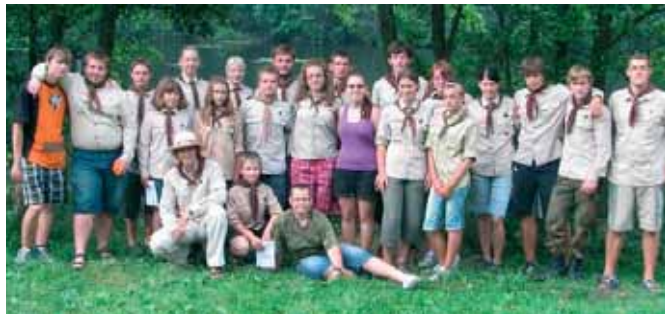
Na letošním táboře putovali skauti v čase

Tábor jsme zahájili již na počátku prázdnin po kratší odmlce v krásném prostředí lesa a rybníka kousek od Dobrohoště u Dačic. Novinkou tohoto roku bylo rozdělení táborových turnusů podle věku účastníků a ne podle oddílů