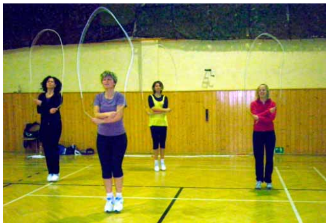
Cvičenci se připravují na všesokolský slet.

Zapojili jsme se do nácvičku celkem tři hromadných skladeb: rodiče a děti „Ať žijí duchové“, starší žactvo „Dávej, ber“ a ženy s dorostenkami ve skladbě s názvem „Nebe nad hlavou“. Cvičenci z těchto dvou skladeb pojedou 1. července 2012 do Prahy. Všechny skladby můžete vidět na Sokolském Brnu dne 17. června 2012 v Brně a taktéž u nás ve Vranovicích v sokolovně v měsíci květnu.