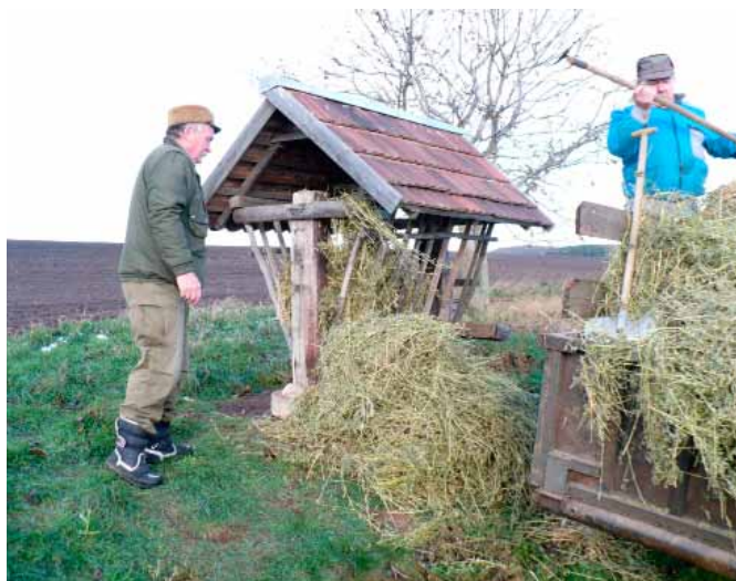
Hlavní činností členů mysliveckého spolku je starost o zvěř.

Myslivecké sdružení má v současné době celkem 28 členů, převážně z Vranovic, Přibic, Ivaně a jednotlivě i z dalších okolních obcí. Těch aktivních členů, schopných zapojit se do naší pracovní činnosti je 19, ostatní jsou vzhledem ke svému zdravotnímu stavu nebo vysokému věku od této povinnosti osvobozeni.