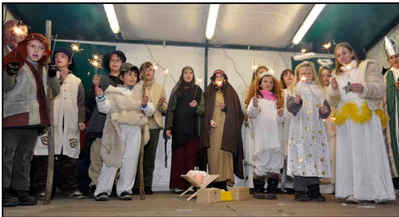
Vánoční jarmark a rozsvěcení stromu