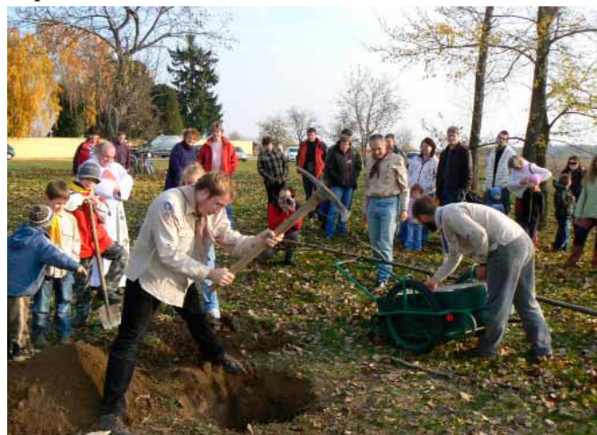
Publikum tvořili především rodiče a prarodiče členů oddílu.