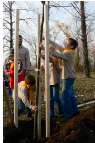
Lípu pomáhali vysazovat všichni, od vlčat po oldskauty.

Podrobnosti o vysazování všech lip najdete na stránkách: http://www.kamchodit.cz .