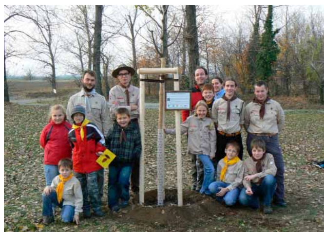
Společné skautské foto s lípou.