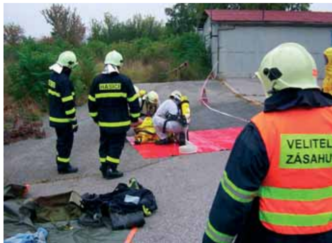
Cvičení v Pohořelicích s námětem únik nebezpečných látek.

■ Dne 1. října byl jednotce v dopoledních hodinách vyhlášen výjezd do prostoru bývalých kasáren v Pohořelicích. Na místě zásahu jsme byli informováni, že se jedná o prověřovací cvičení s námětem únik nebezpečných látek.