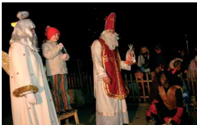
Pro mikulášskou nadílku si na Návěs přišla dobrá stovka dětí

a ratolesti si na poslední chvíli předříkávali koledy. Bez nich totiž žádný dárek Mikuláš nevydal. Respekt těch nejmenších dětí před mikulášskou svitkou střídala roz dováděnost starších „mazáků“. Ty však vzápětí spacifikovali čerti s pytlem. Do pekla se totiž nechtělo ani ostříleným klukům.