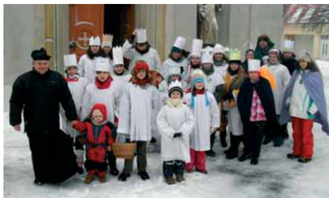
Všichni králové (i královny) se před charitativní výpravou sešli u kostela.

Tříkrálová sbírka organizovaná Charitou Česká republika byla letos jubilejní - desátá. Obyvatelé Vranovic měli v sobotu 9. 1. 2010 příležitost přispět do sbírky však teprve po deváté. Děkujeme všem štědrým dárcům za finanční příspěvek i koledníkům za účast. Na účet Charity bylo z naší obce v letošním roce zasláno celkem 47 099 Kč.