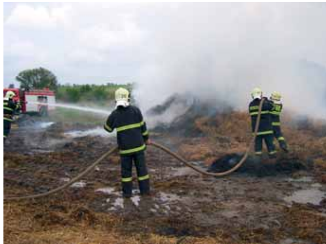
Požár stohu v Pasohlávkách

■ 18. října byl v dopoledních hodinách vyhlášen jednotce výjezd opět na stejné místo k požáru stohu u Pasohlávek. Zásahu se zúčastnili tři členové jednotky. Na místě jsme byli pověřeni doplňováním vody a dohašování několika ohnisek požáru. Zasažovalo zde několik profesionálních i dobrovolných hasičských sborů.