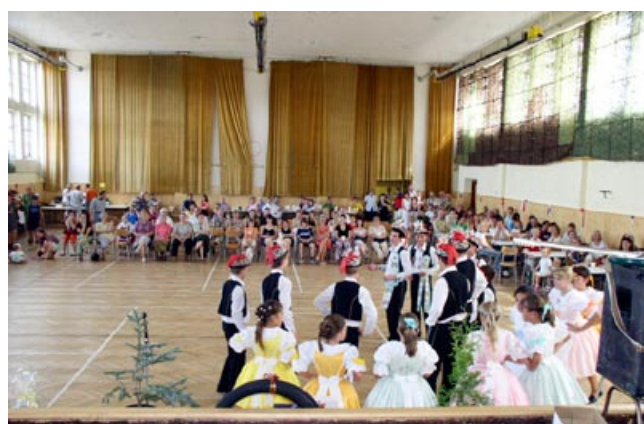
Z hodového programu