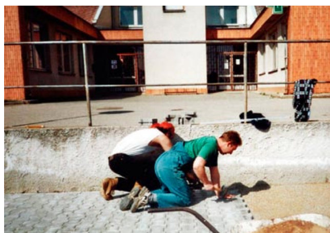
Práce na dětském koutku