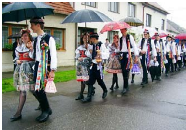
Májová 2006 - velcí stárči