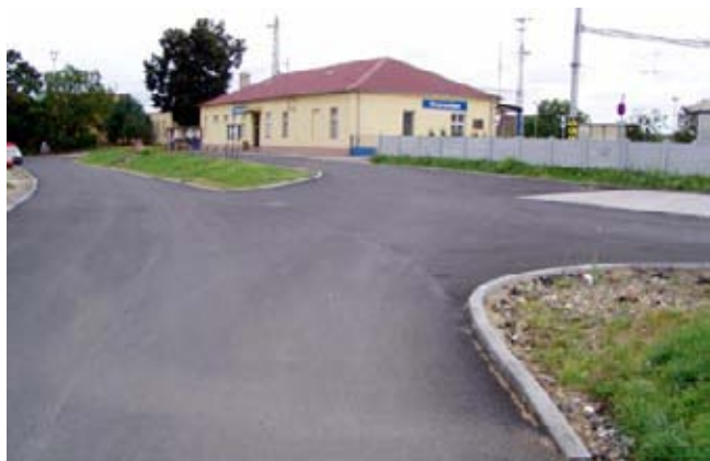
Zrekonstruovaná silnice u nádraží