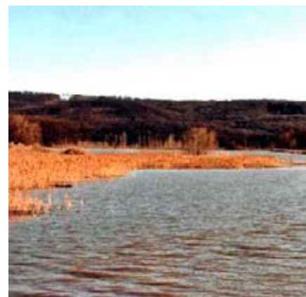
Začátek dubna za vranovickou brází - pohled na Kolbu

Těšíme se na Vás! Vezměte si s sebou: sešit, propisku, olomoucký kancionál (modrý), Bibli – český ekumenický překlad).