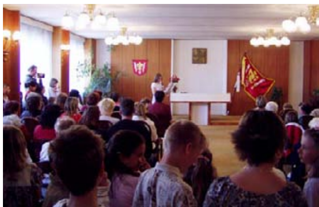
Den matek 2006 - Obecní úřad