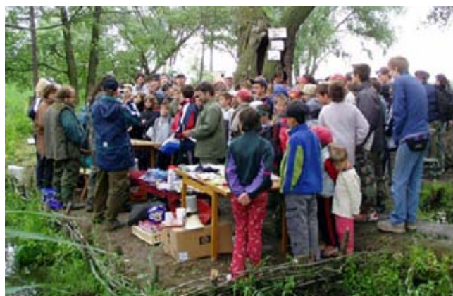
Momentka z rozdílání cen na rybářských závodech