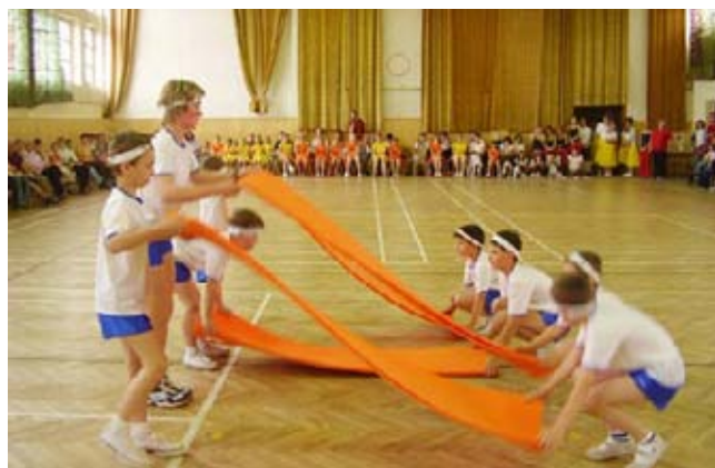
Příprava na slet