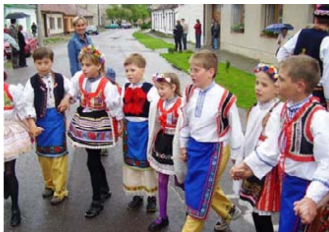
Májová 2006 - malí stárči