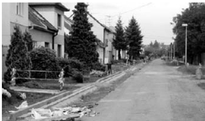
Úprava komunikace na ulici Přibická