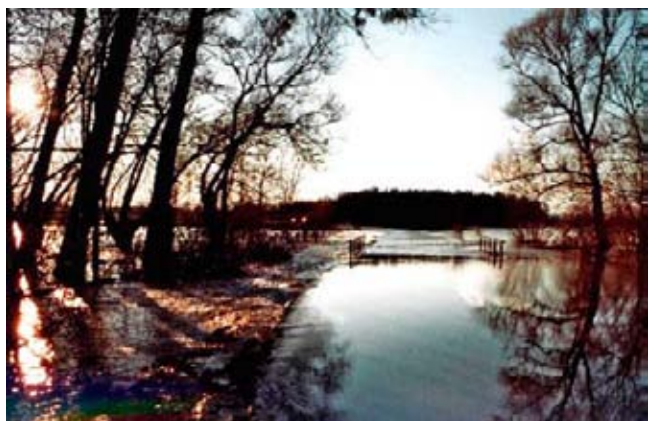
Mostek na cestě do Uherčín v zapadajícím slunci