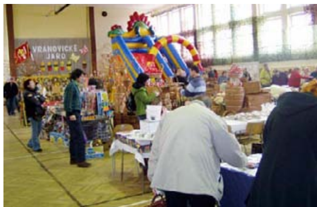
Vranovická jaro - celkový pohled