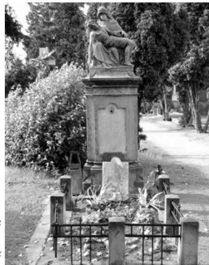
Očištěný opuštěný hrob na hřbitově