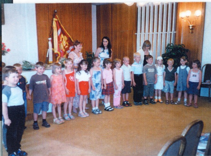
Rozloučení dětí s mateřskou školkou, oslava na OÚ, 29.6.2005