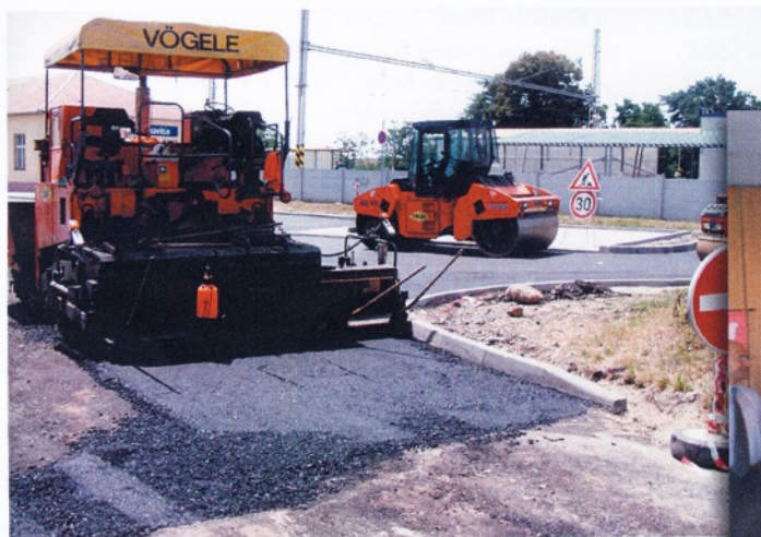
Pokračování prací na opravě silnice „Nádražní ulice“