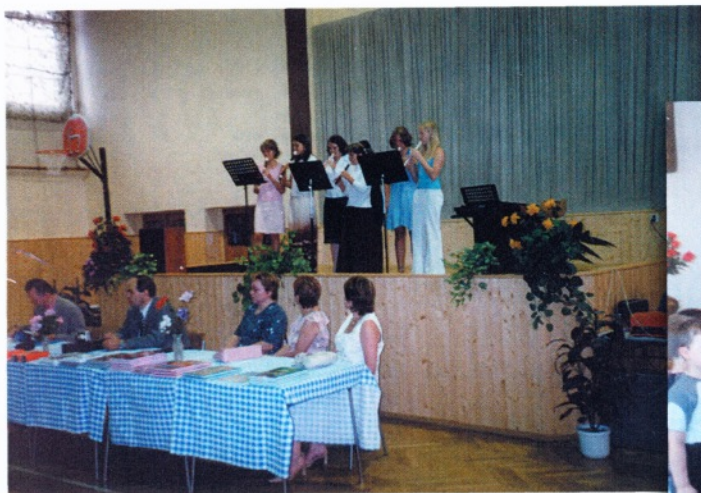
Vystoupení žáků ZUŠ při zakončení školního roku v sále Sokolovny