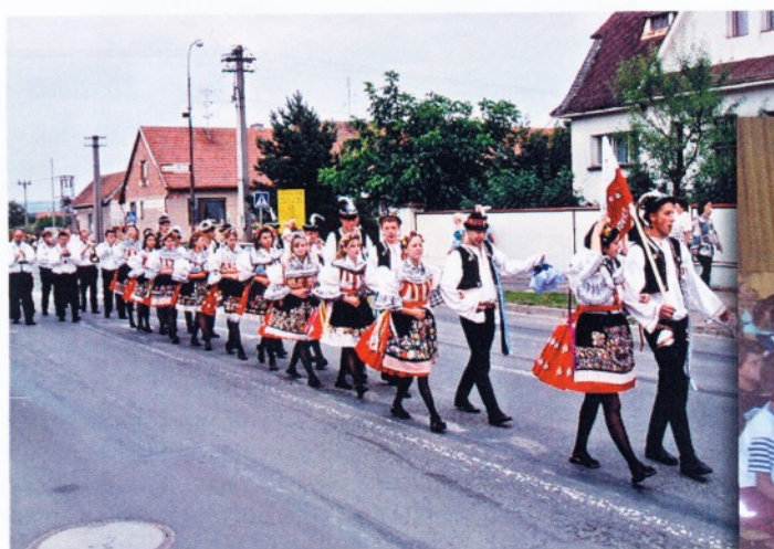
Průvod krojovaných - Hody 2005