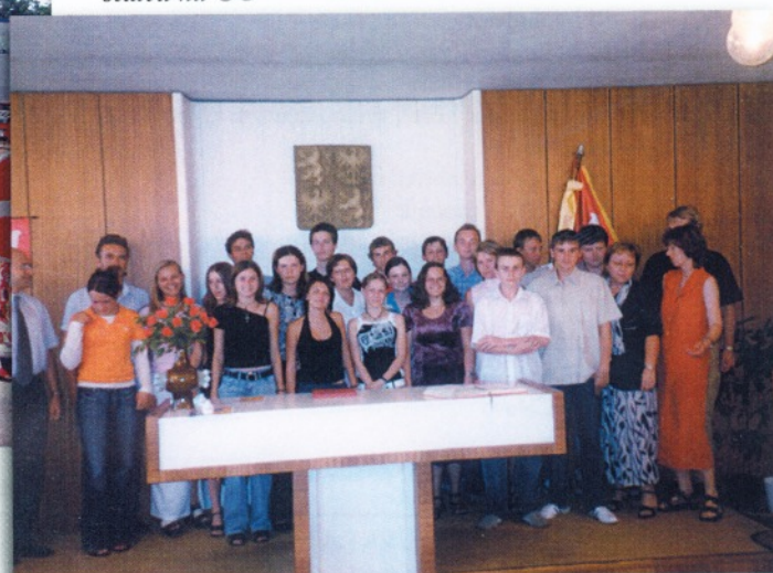
Slavnostní zakončení školního roku 2004/2005 v SOKOLOVNĚ, 30.6.2005