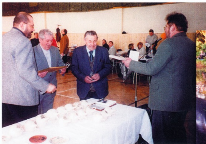
Výstava vín - ocenění nejstarších členů vinařů