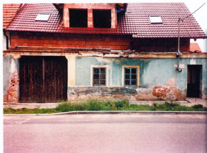
Postupně ve Vranovicích mizí stopadesát a víceleté domy