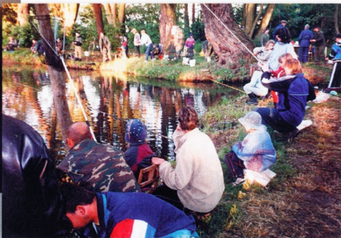
Soutěžní den k MDD - mladí rybáři mají plné ruce práce