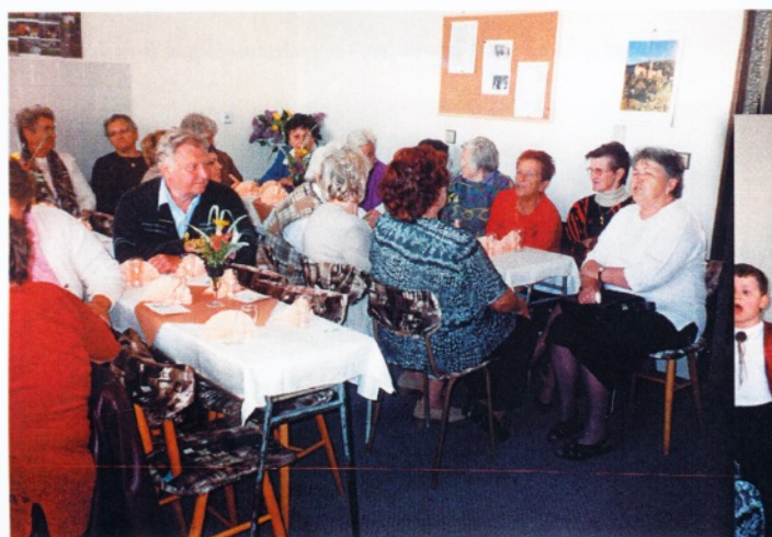
8. květen, klub důchodců - posezení ke dni matek