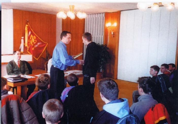
Výroční schůze SK Vranovice - ocenění nejlepších hráčů