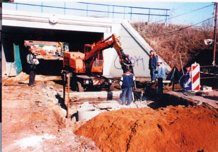
Kanalizace březen 2005 - úprava koryta potoku pod silnicí