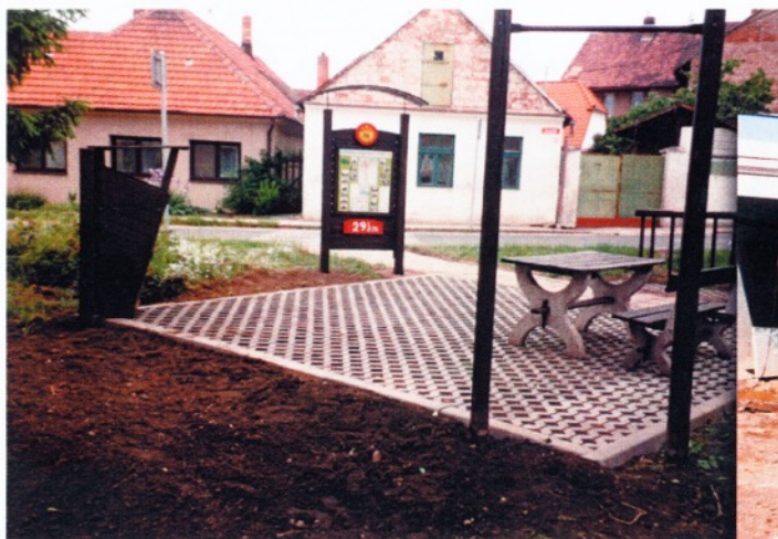
Nové odpočívadlo ve Vranovicích - cyklistická stezka