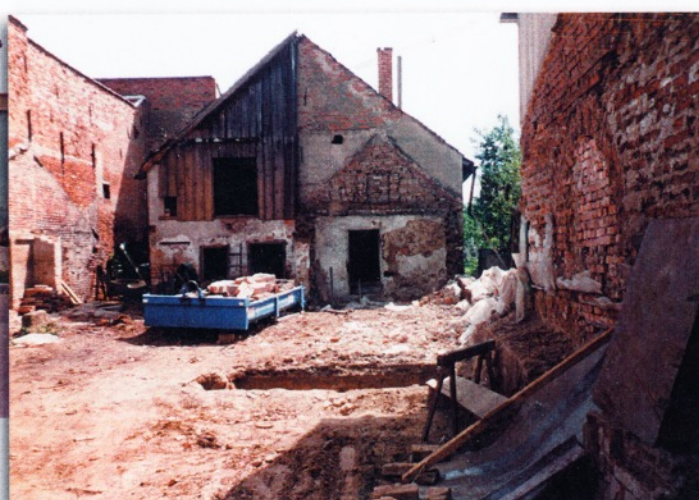
Ještě nedávno zde stál dům č.p. 94, zbytek dvorního stavení