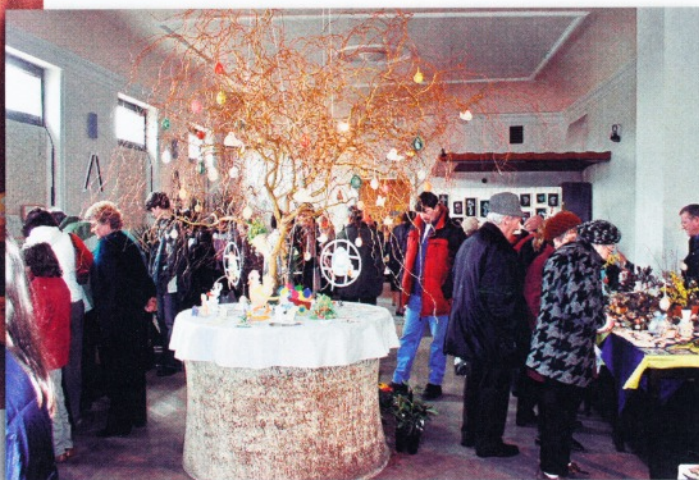
Vranovické jaro - prodejní výstava „U Fialů“