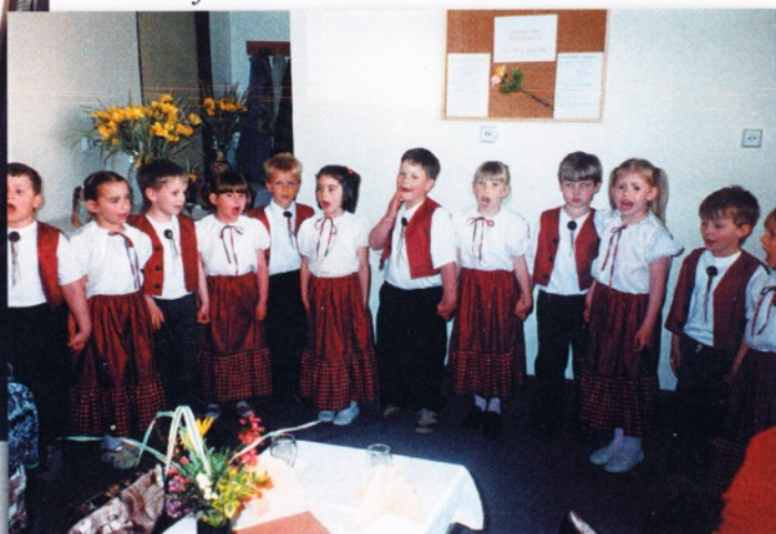
Děti, které se postaraly o kulturní vložku svým zpěvem a tanečky - klub důchodců