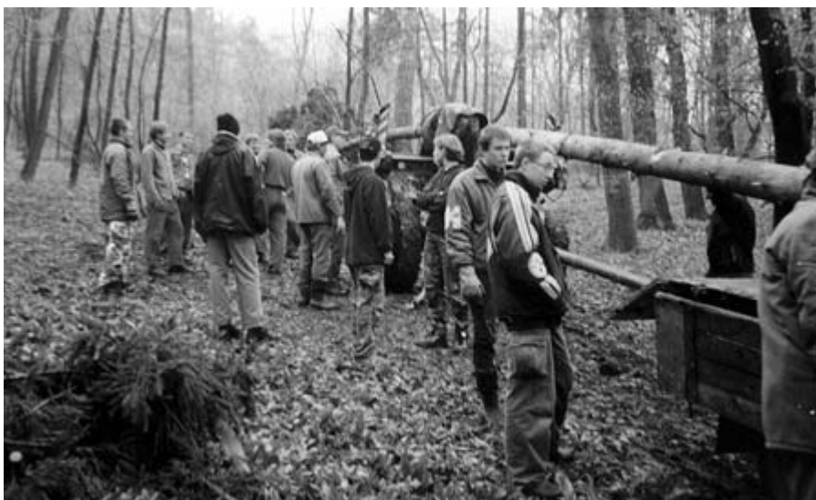
□ Májová 2003 - Stárci nakládají máju na traktor