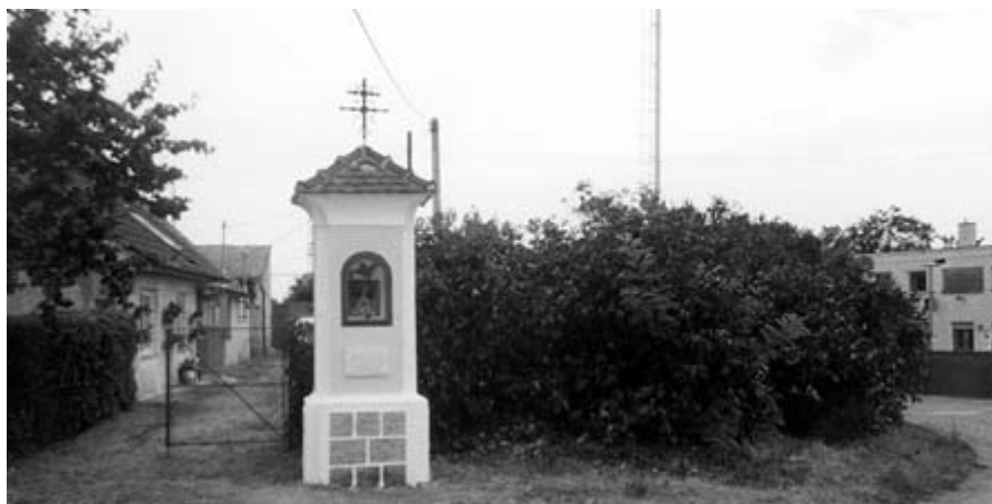
□ Renovovaná kaplička u závor

I když jsme v období zahájení dalšího školního roku, dovoluji mi, abych se vrátil na konec minulého školního roku. K tradičnímu vyřazování dětí z MŠ jsme poprvé pozvali i žáky devátých tříd. Tito opouští školu po devíti letech a při slavnostním ukončení školního roku ve sportovní hale není na toto prostor. Až na několik žáků (3) se zúčastnili všichni, s některými přišli i rodiče. Na památku obdrželi drobné dárky (pamětní list, zvoneček se znakem obce a odznak).