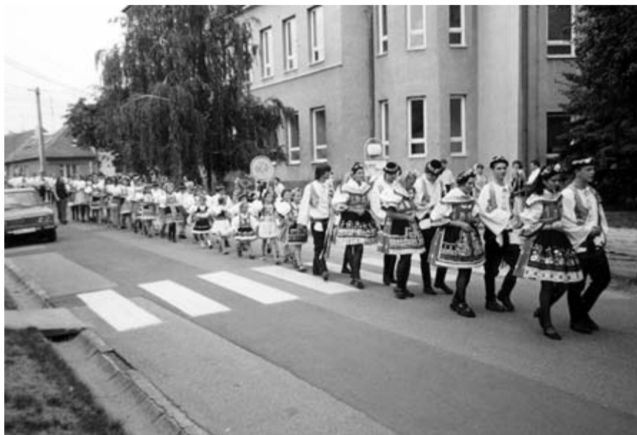
□ Průvod stárků, stárek a těch nejmladších - hody 2003

chvilu trvalo. Když začali hrát bylo již po půl jedenácté. Do té doby se stárci snažili bavit hosty. Začali opravdu vtipně písničkou Prší, prší jen se leje. Jakmile kapela začala hrát, hosté ji přivítali ohromným potleskem. A kapela se snažila jakoby vše dohnat. Hrála téměř bez přestávek, hosté se neuvěřitelně dobře bavili. Stárci pro ně připravili trenkové a podprsňkové sólo. Po půlnoci však začali stárci postupně „odpadat“. Únava předchozích dnů se na nich projevila. Na zábavu se přišlo pobavit asi 300 lidí, většina z nich vydržela „hodovat“ až do samého rána.