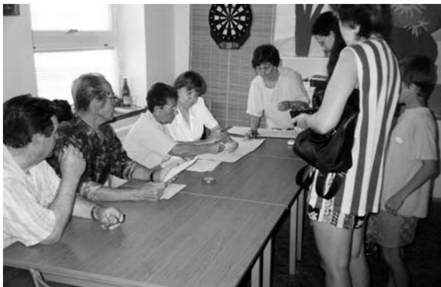
□ Práce okrskové komise č. 2 s voliči při referendu o vstupu ČR do EU