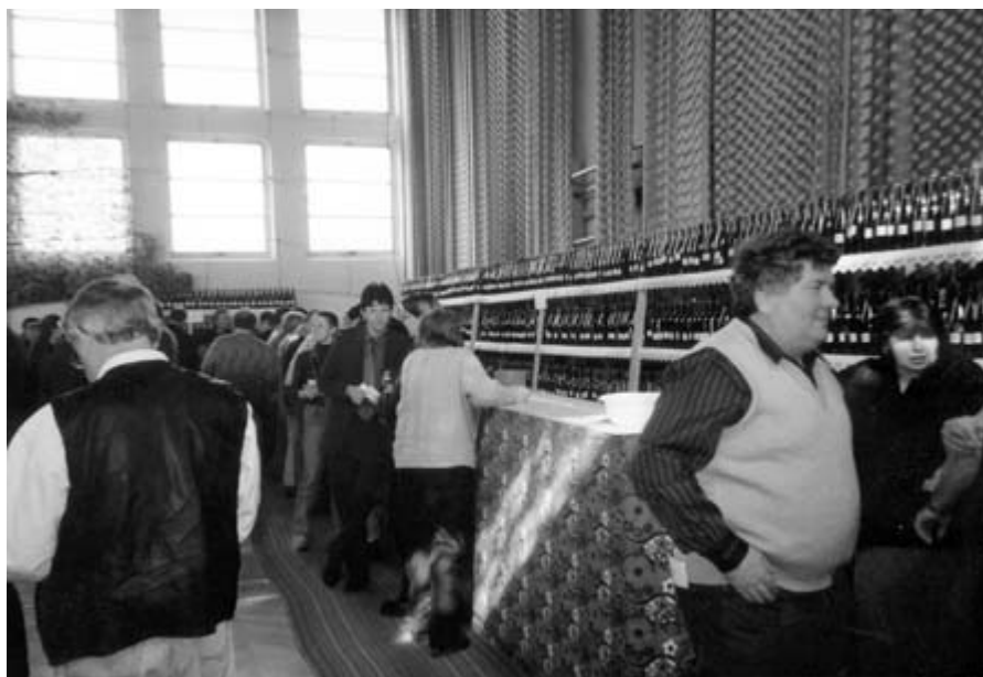
□ Výstava vín ve Vranovicích, březen 2003