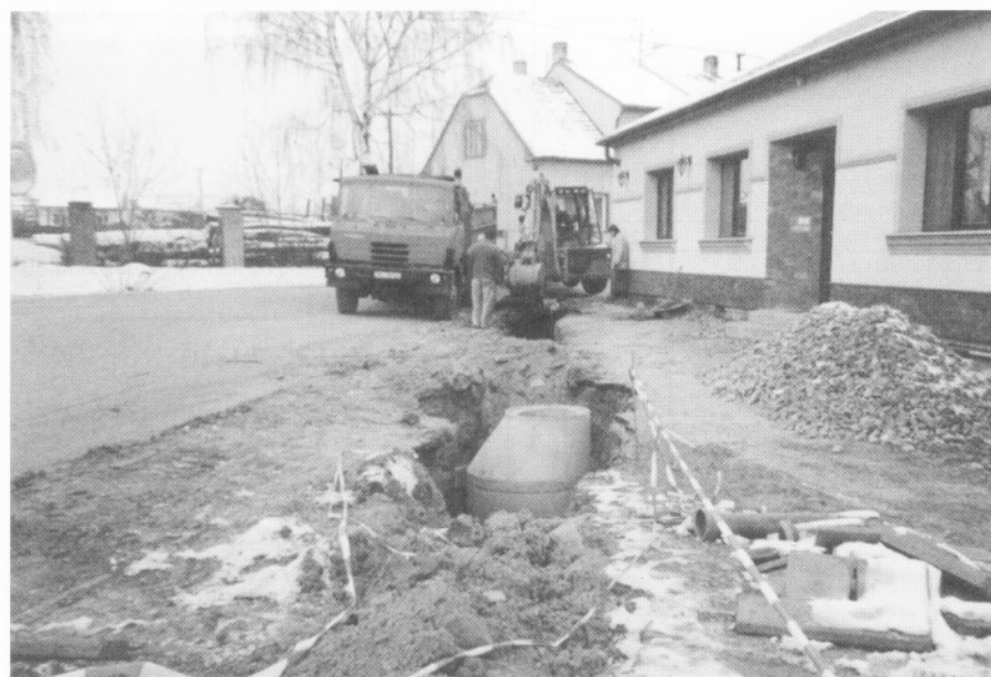
□ 14. ledna 2002 - rozjíždí se práce na kanalizaci

Dne 20.12. 2001 uspořádala ZUŠ Pohořelice pobočka Vranovice Vánoční koncert, na kterém se představili téměř všichni vranovičtí žáci. Vystoupili zde jako hosté žáci z Pohořelice, kteří přednesli skladby na hudební nástroje, které nejsou ve Vranovicích vyučovány, tj. trombon a trubka. Naši žáci se představili především hrou na klavír, housle a flétnu, pouze Jiří Gebauer předvedl hru na křídlovku.