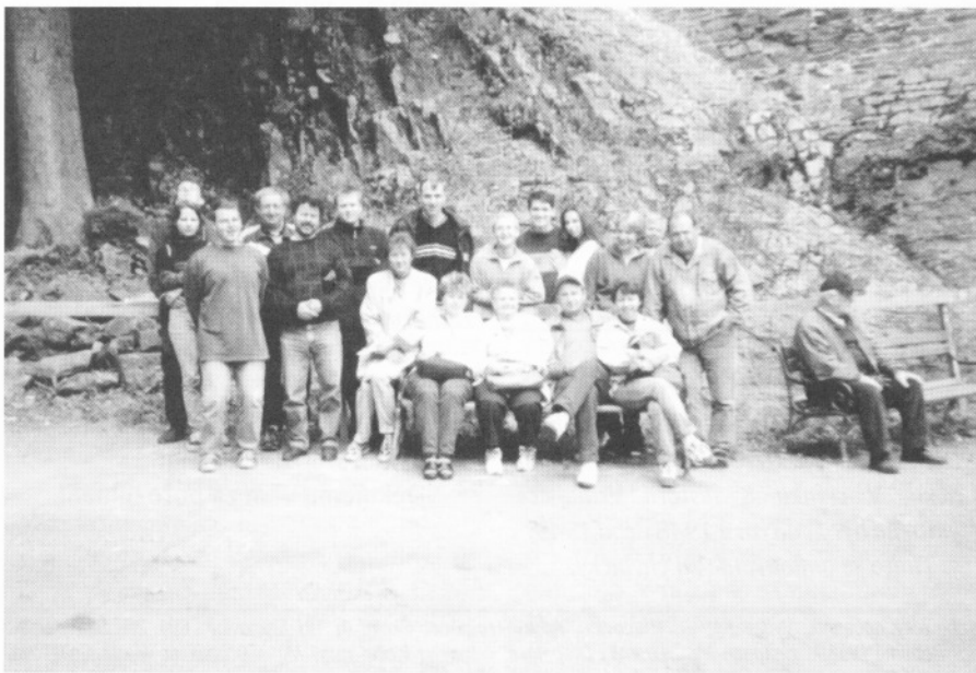
□ Kolektiv hasičů - hrad Pernštejn