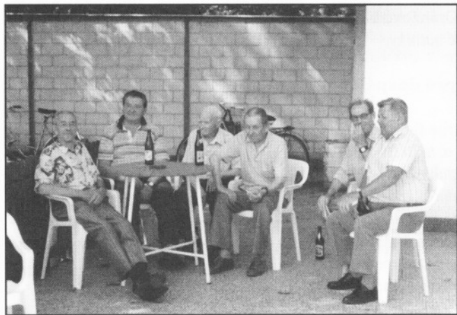
□ Fotbaloví senioři při zápasu s V. Bílovicemi 19.8.2001