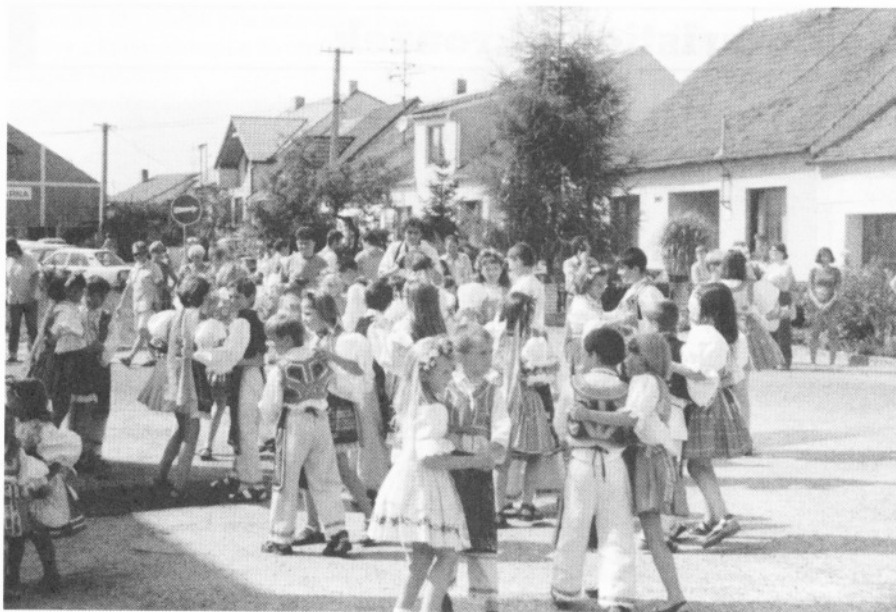
□ Mládež se baví - hody 19.8.2001