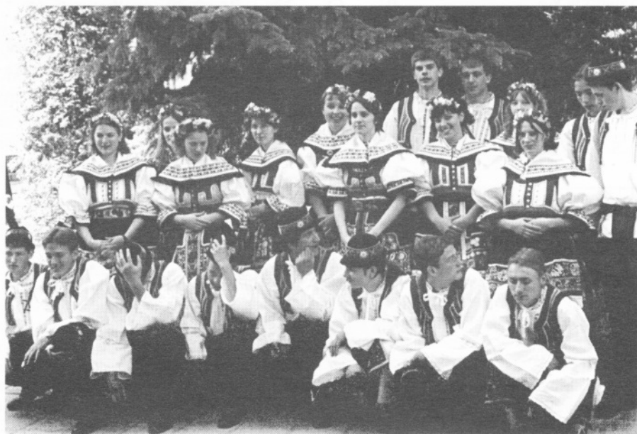
□ Stárky a stárce ročník 1982

Májová zábava byla zahájena vpochodováním krojovaných dětí a pak ročníku, který uvolnil na půl hodinky sál pro děti, které při hudbě tancovali (pod vedením 2 dívek) několik tanečků. Pak nastoupili stárce a stárky a začala zábava. S tancem,