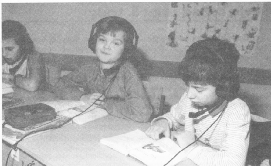
□ Hodina německého jazyka. Žáci 4. třídy v jazykové učebně.

a já mám psát domácí úkol. Ptáček tu zpívá, břízky tu šumí, šťasten je ten, kdo na zítřek umí.