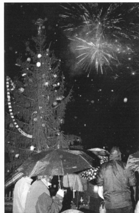
Rozsvícení stromu provázel déšť i ohňostroj