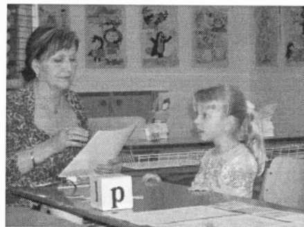
JR Ze zápisu