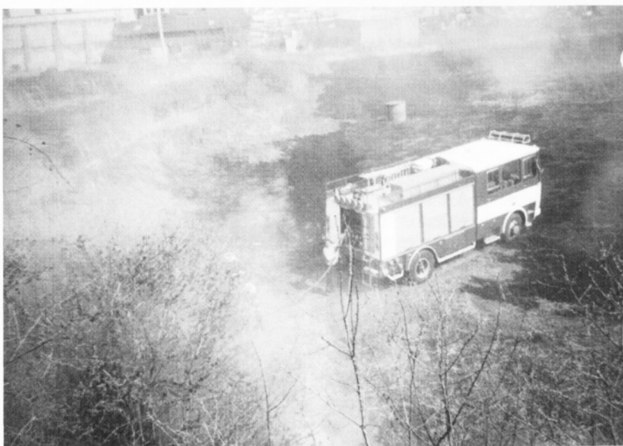
Požár v dolině vzniklý z nedbalosti občana.

Děkujeme za pochopení a těšíme se na Vaší návštěvu.