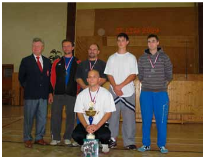
Vranovická elita