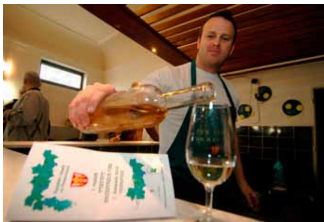
Láhve s vínem opatřili vinaři nově i jednotnými etiketami.

Letité poklady z vinných sklepů koštovali ve velkém příznivci starého vína ve Vranovicích. Tamní vinaři uspořádali v sobotu v sále restaurace U Fialů první ročník koštu archívních vín. Sešlo se tu na dvě sta čtyřicet exkluzivních vzorků. Z nejbližšího okolí ale také například ze vzdálených Bučovic, či proslulého Pavlova.