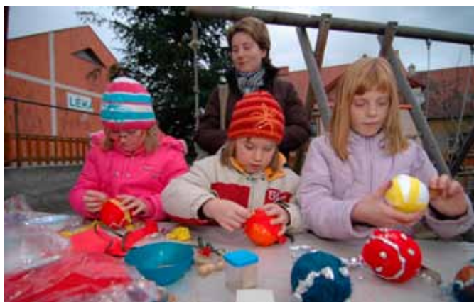
U stolu s výtvarnou dílnou pro děti bylo stále plno