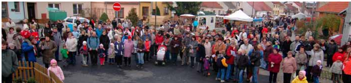
Organizátoři letos poprvé vsadili na celodenní zábavu. A na Návěs přišlo odhadem 800 až 1000 lidí.