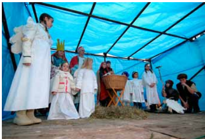
Představení Živý Betlém v podání žáků školy