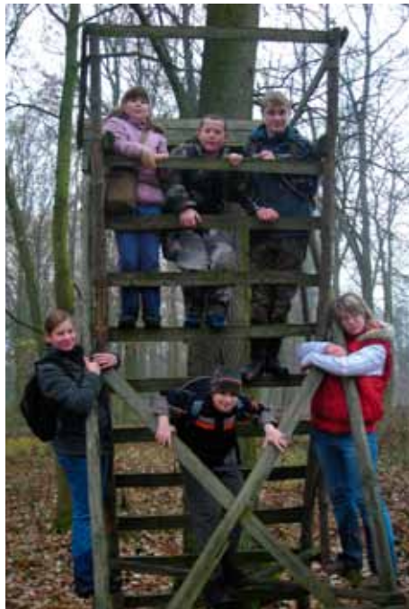
Oceloví skauti se v mlze neztratili.

Cílem našich nejmladších, tj. vlčat a světlušek, byly 21. listopadu Uherčice. Cesta vedla přes pole u naší klubovny až