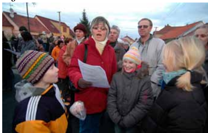
Podvečerní společné zpívání koled navodilo předvánoční atmosféru