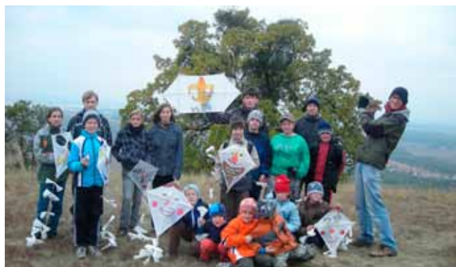
Účastníci drakiády na Kolbách. Ten úplně vpravo právě stahuje draka ze 100 metrové výšky.

V klubovně je ryk a kravál jako obvykle. Vejdu – plno lidí a všude poházené papíry, provázky, špejle a ještě jednou všude nepořádek. Není se co divit – když se sejde oddíl, tak to tak potom taky vypadá. A když se dělají draci – létají papíry. Večer je konečně hotovo. Zítra je jdeme vypustit.