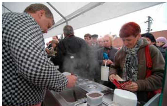
Fronta na zabijačkové speciality nebrala konce