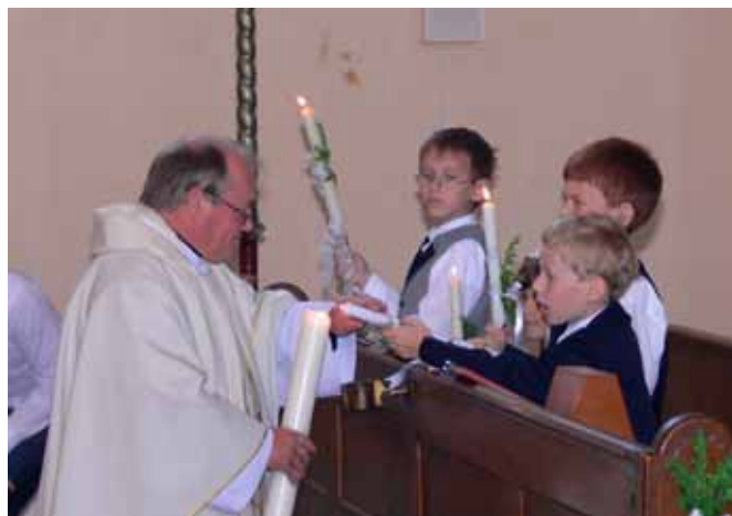
Zapalování křestních svíček před prvním svatým přijímáním od velikonoční svíce.