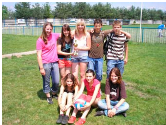
Pohár starosty zůstal doma.

Nesmíme ovšem zapomenout ani na naše volejbalisty,