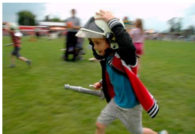
Soutěživost capartů překonávala nástrahy, mezi něž patřila i těžká hasičská přilba. Koneckonců, odměna byla sladká.