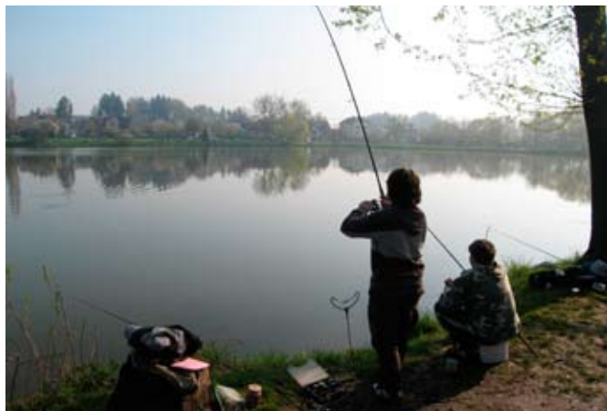
Modrá obloha a ranní mlha nad rybníkem, to je ta pravá atmosféra pro rybáře.