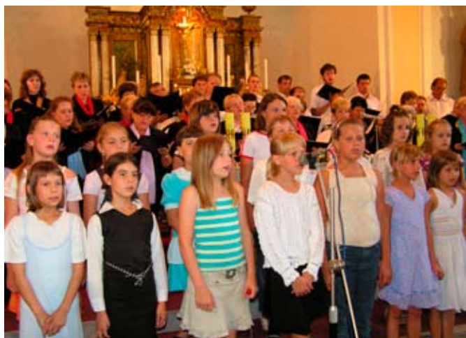
Vystoupení pěveckého sboru oživil tentokrát i doprovod malých zpěváků ze základní školy.