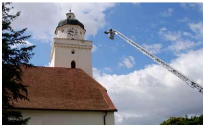
Speciální technika pod věží pohořelického kostela, při simulovaném požáru.