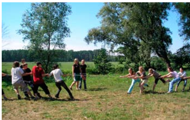
Deváťáci připravili pro své mladší spolužáky na každém stanovišti úkoly.