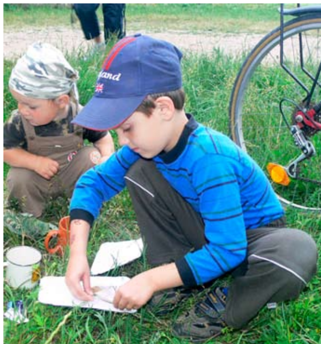
Táboráku před skautskou klubovnou předcházely hry a soutěže pro nejmenší.

14. 6. 2008 - Společenství mládeže vranovické farnosti uspořádalo pro mladší děti, ministranty a jejich rodiny farní táborák. V rámci zakončení školního roku čekalo na účastníky před skautskou klubovnou i několik soutěží, na kterých si procvičili svoje znalosti z náboženství, ale zahráli si i petang, procvičili paměť a vytvořili, doslova vlastními těly, kousek plakátu, který je v současné době vystavený ve vranovickém kostele, jako pozdrav účastníků táboráku všem ve farnosti. Odměnou pro každého byly drobné sladkosti a malé dárky. Největší radost však malým i velkým udělal samotný táborák s opékáním špekáčků a také další zábavné hry na louce před klubovnou. Po soumraku pak pořadatelé zůstali u ohně a zakončili celou akci zpěvem s doprovodem kytar.