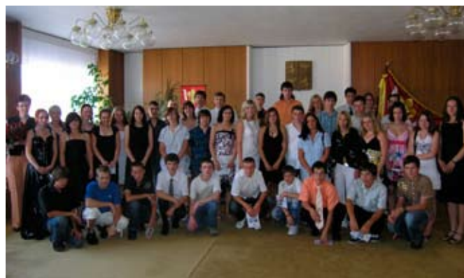
V obřadní síni obecního úřadu se devátáci sešli všichni pohromadě naposled. Po prázdninách se rozutečou do různorodých škol a učilišť.