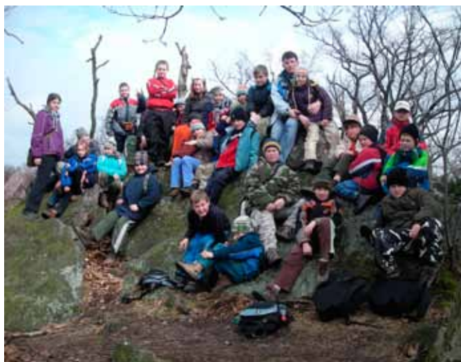
Účastníci výpravy.

Druhý den, tedy v sobotu, byl v plánu výšlap na blízkou rozhlednu Babí lom. I když by se to možná nezdálo, nejvíce se líbila - hlavně menším účastníkům, část cesty z rozhledny, která vedla přes samé balvany a skály, že někdy byli ve „skálolezení“