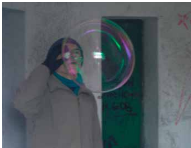
Muž s bublinou.

Poblíž jedné obce v blízkosti Brna se pod kopcem Strážná nachází skautská základna. Ta se pro nás, skauty z 2. vranovického oddílu Jaguáři, stala 13. - 15. března dočasným domovem při výpravě do končin kolem Lelekovic. V pátek jsme se sice kvůli nepřízní počasí museli stáhnout do objektu základny, ovšem její prostorové dispozice byly zcela dostačující, abychom se mohli postarat o zábavu našich pětadvaceti svěřenců.