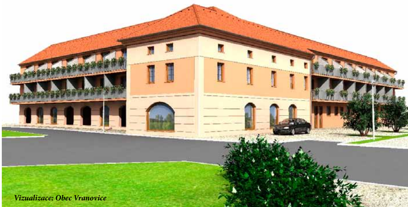
Vizualizace: Obec Vranovice