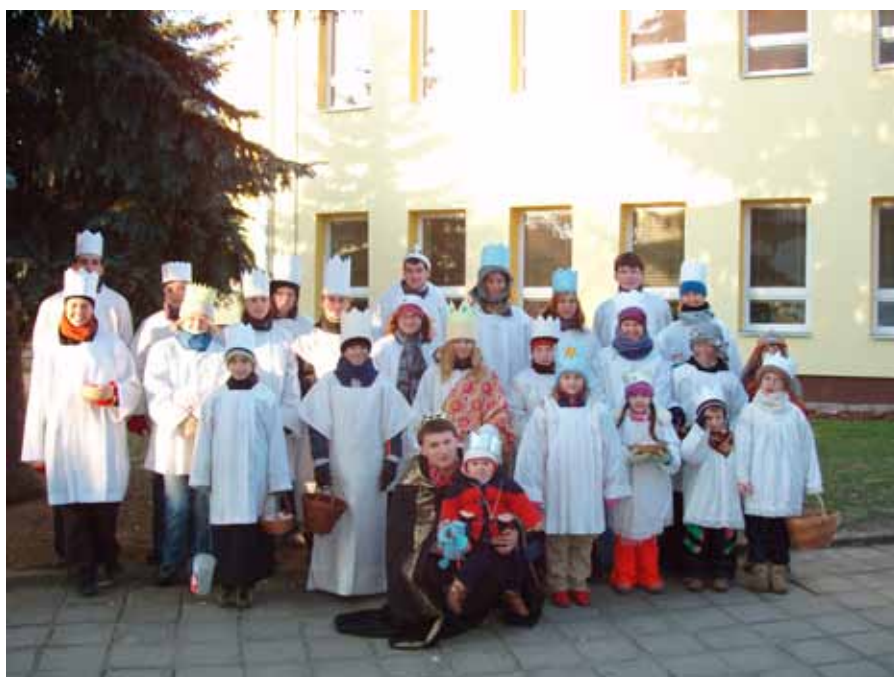
Koledníci vykoledovali téměř 37 tisíc korun.