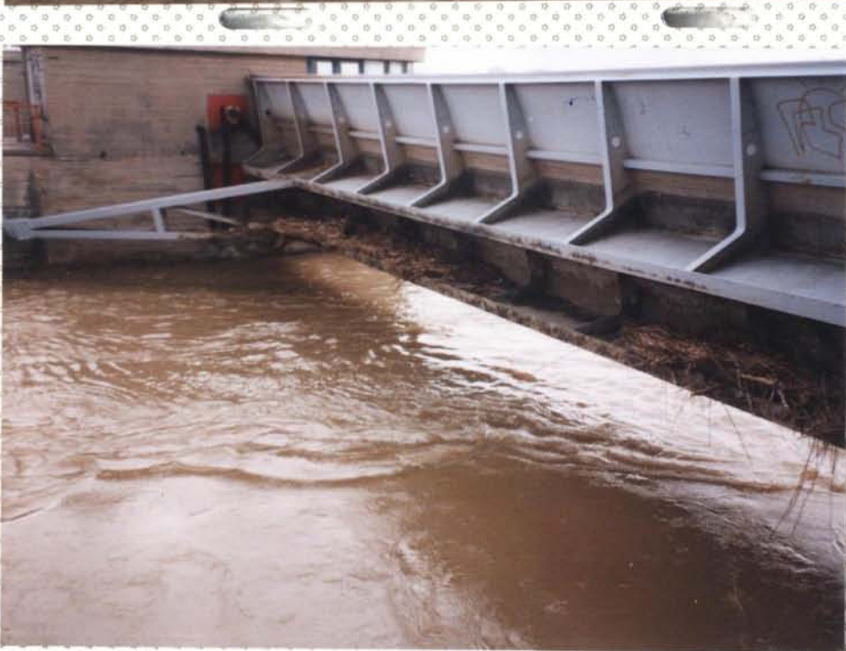
Ztvrdlé stavidlo zajištěné vyrovnané hladiny nádrží