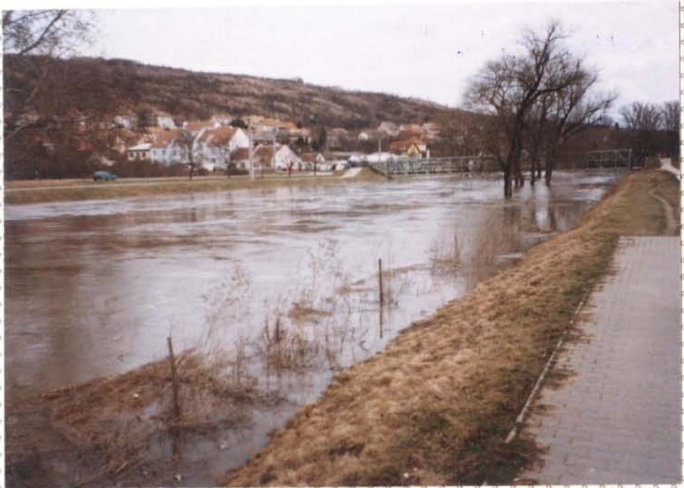
11. povodňový ústředí na řece Svatce