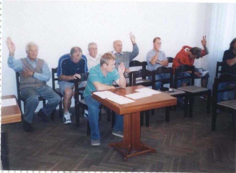
Členové SK Vranovice kteří se zúčastnili volby