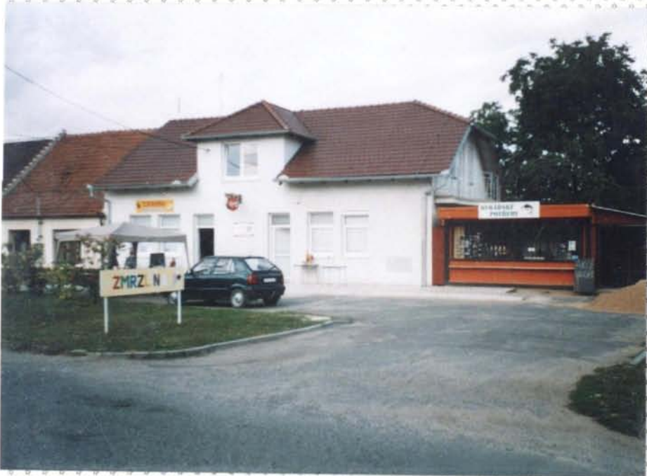
Rekonstrukce domu na prodejnu zeleniny, cukrárnou a kavárnu přístavek prodejny rybářských potřeb /Lelivce/