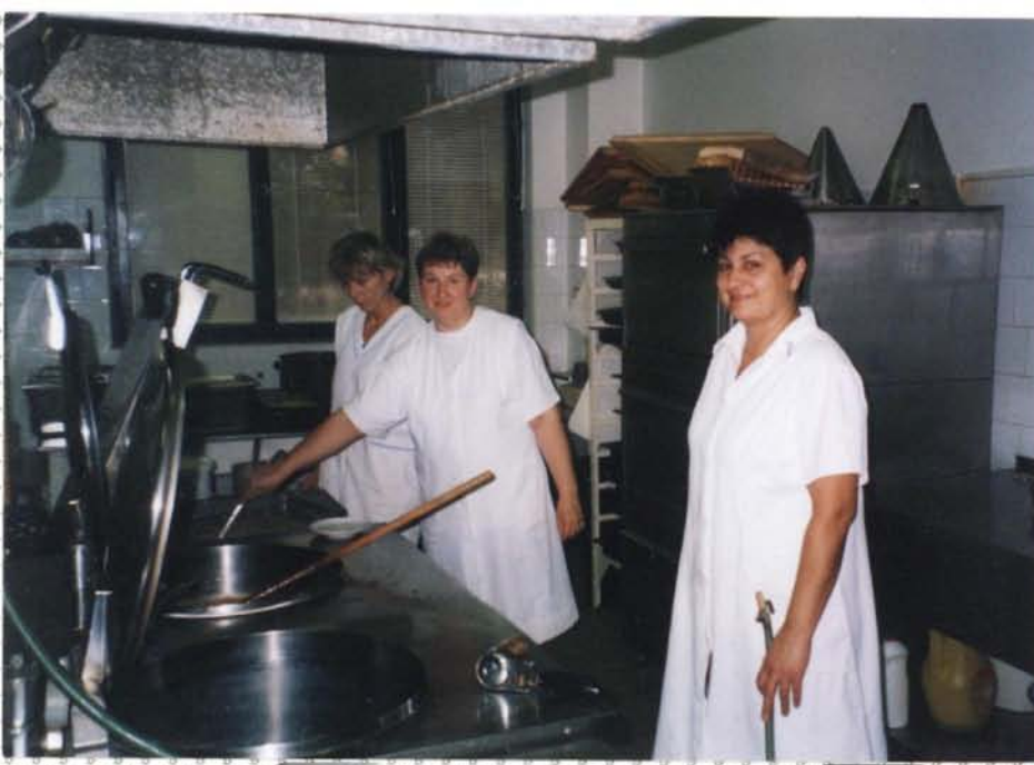
Kuchařky školní jídelny