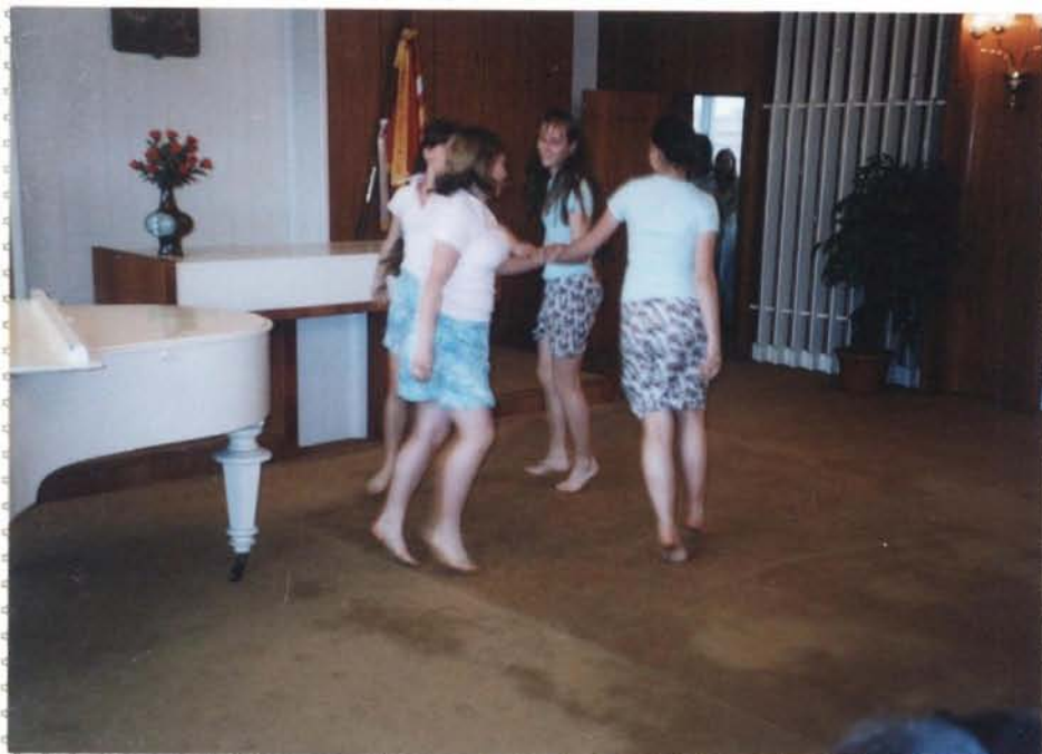
Vystoupení tanečnicko kroažke