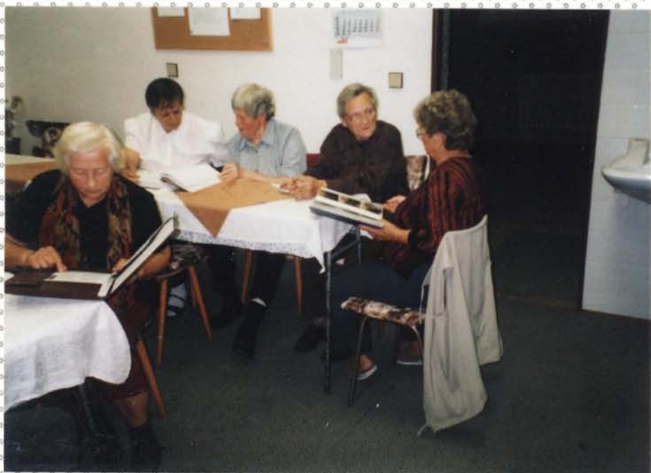
Zamyšlení nad kronikou 2.10.2006

Klub důchodců, odpoledne při kávě, prohlídka obecních kronik účast 18 důchodkyň