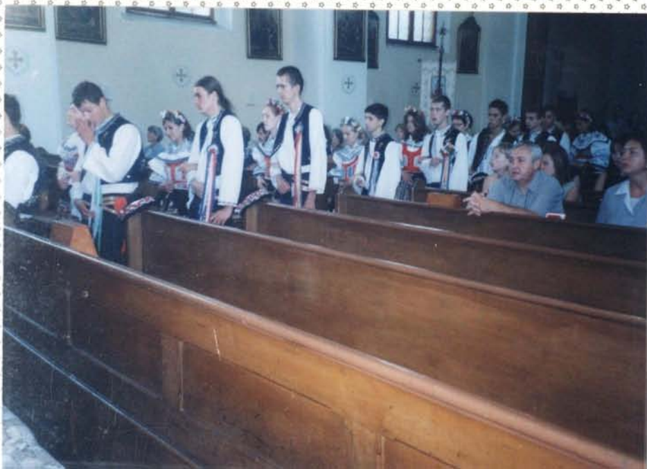
Vranovské bratry 19. 8. 2006 účast stárků a stárček na mši svatě v místním kostele