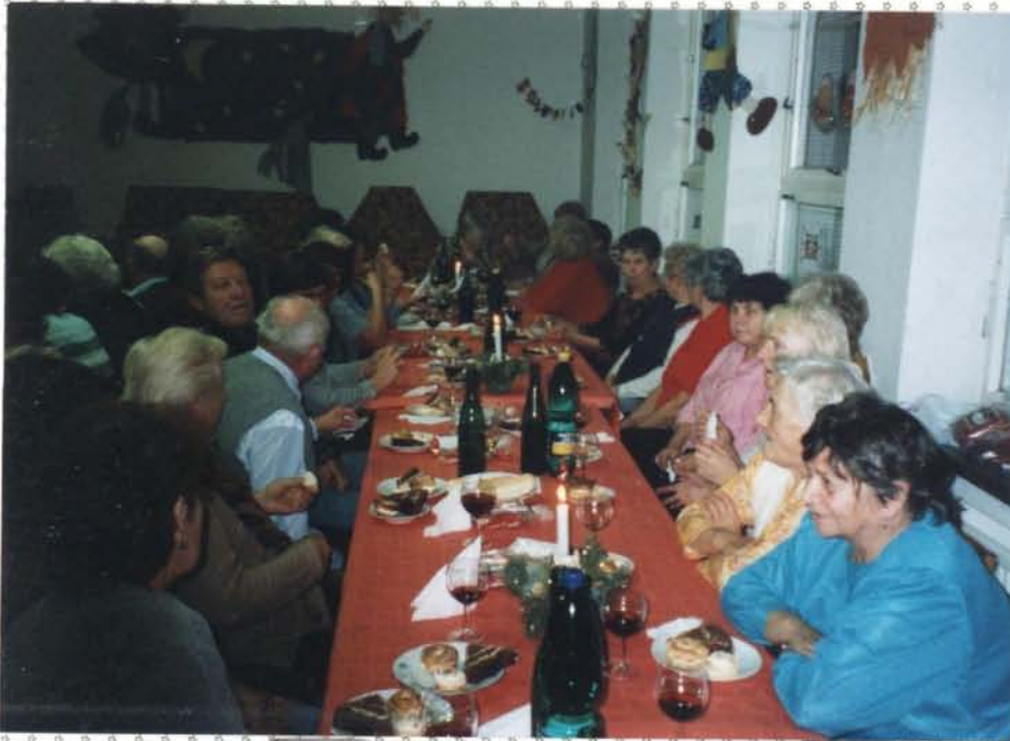
Mikulášské posezení důchodců ze školním klubu 5.12.08