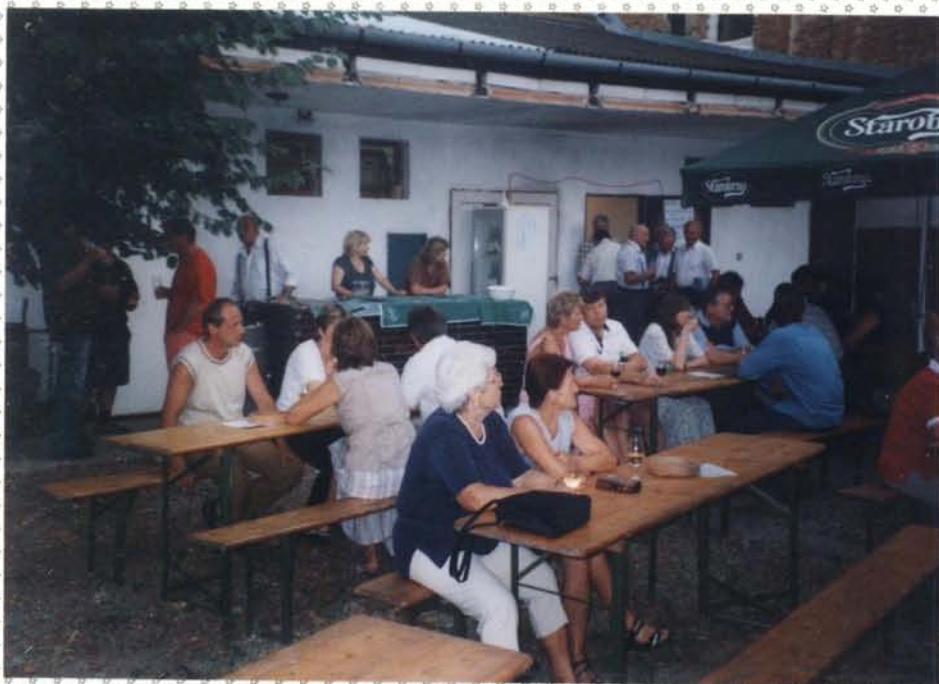
29.7.2006 Posezení u cimbálu se kobalo na zahrádě v restauraci u Fialy