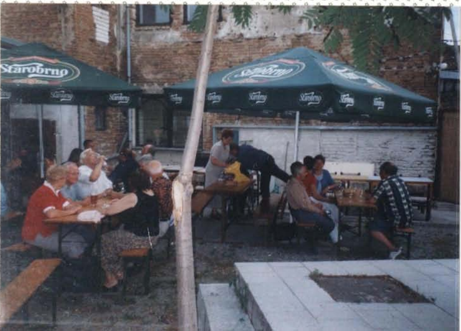
Časí akce přišlo letací počasí a dobrá společnost Akce pořádají vínaři.