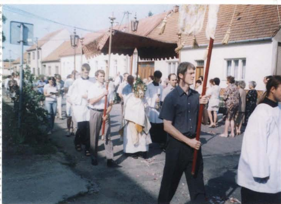
Následuje přenesení k oltáři č. 2 (Machovi)