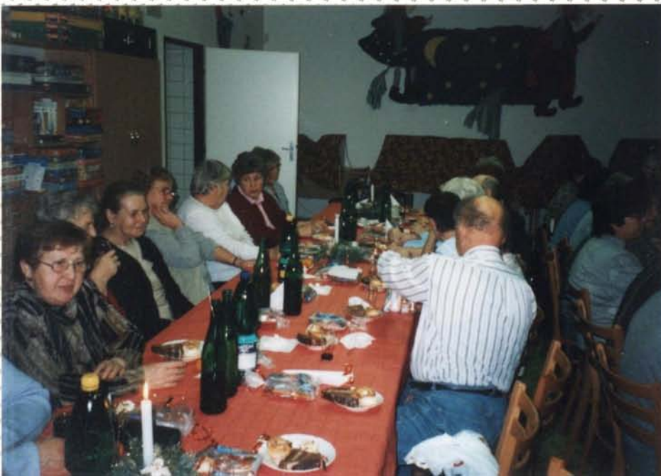
posedění při tomalých účast 53 důchodců a dětí