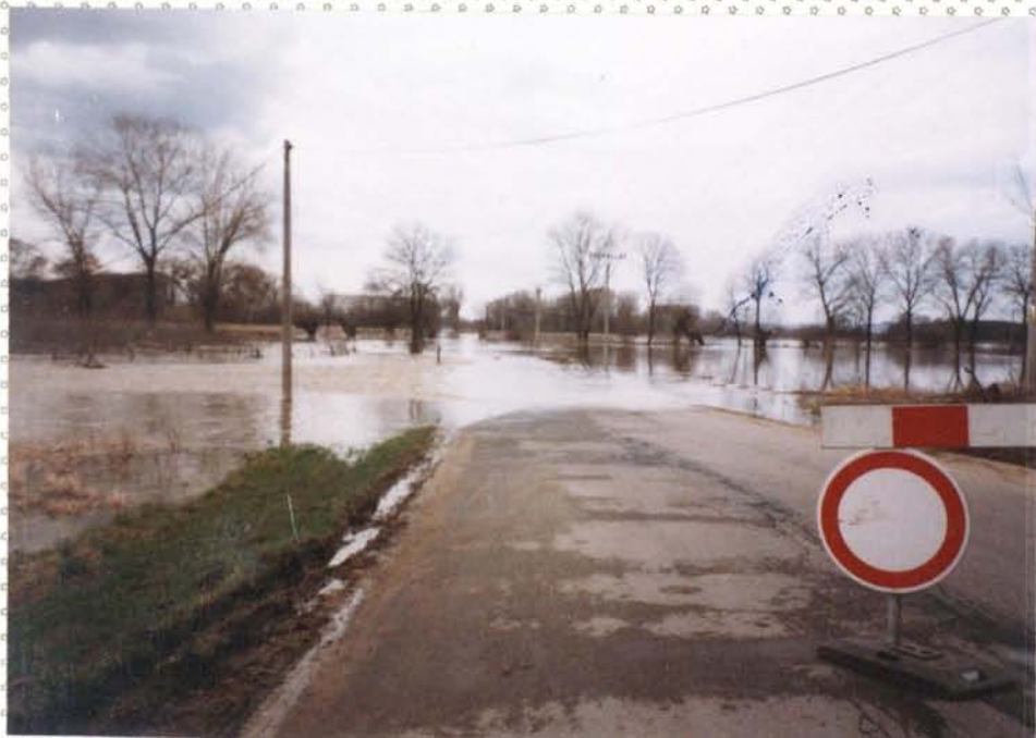
Voda zaplavila silnici Příbrze - Polsoňelice