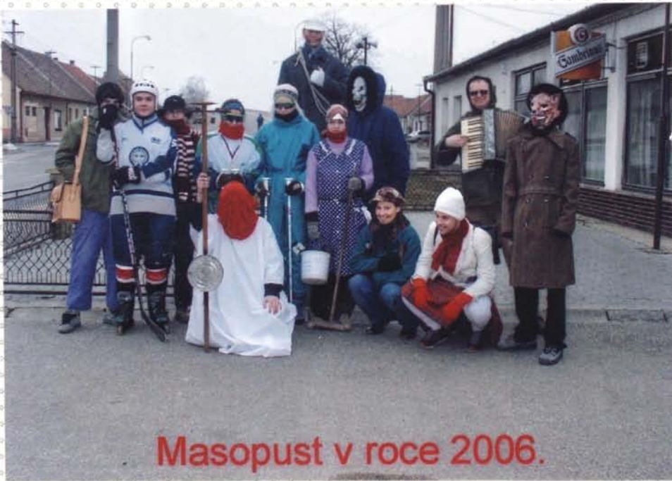
Masopust v roce 2006.

Masopustní průvod se konal převážně za účasti ročníku 1988.