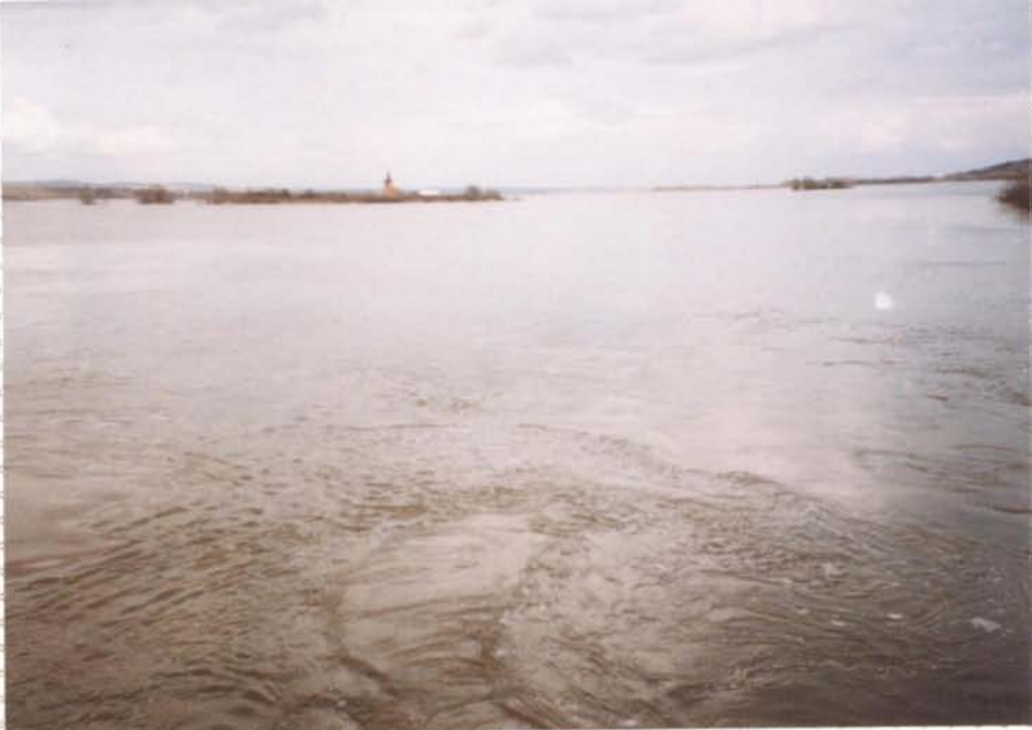
Hušovská jezera, střední nádrž - Mušov