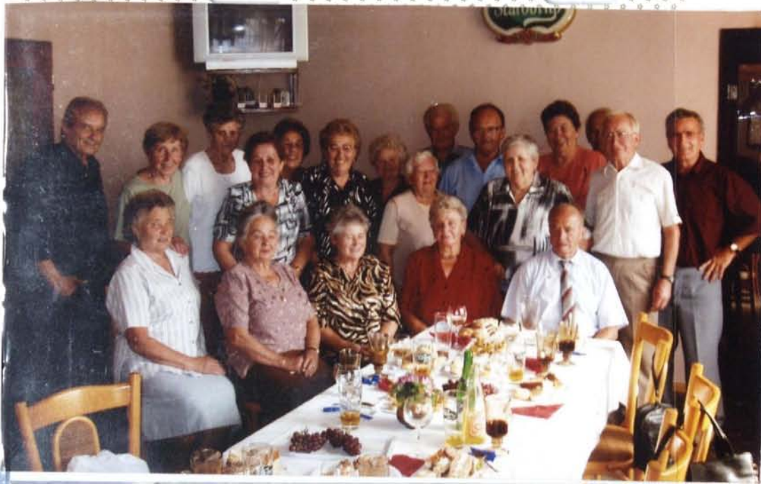
10.9.2005 Setkání vranovických rodáků ročník 1932 /hostinice u Fralů/