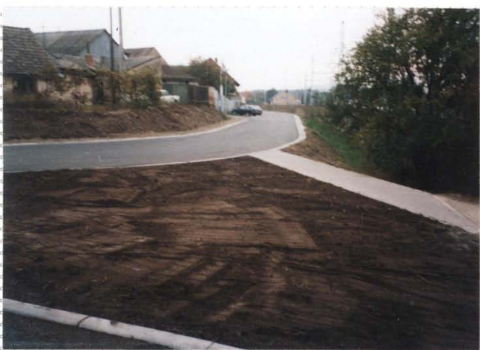
Pohled na opravenou komunikaci