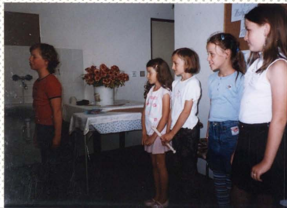
Vystoupení dětí ze základní školy