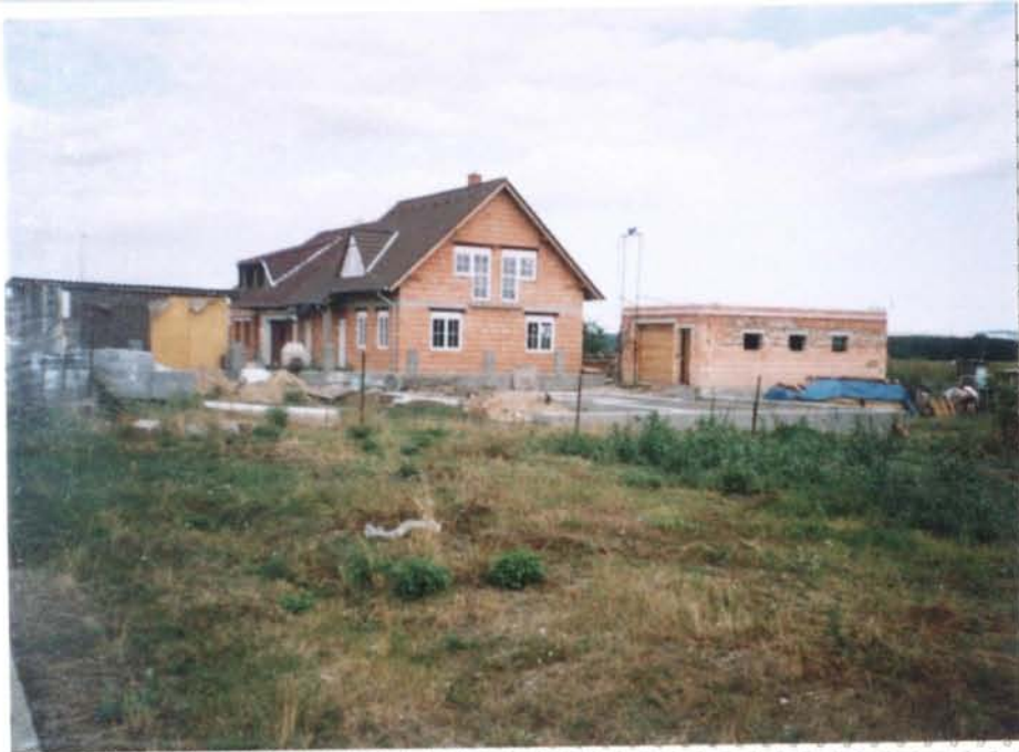
Novostavba na ulici Nosislarska