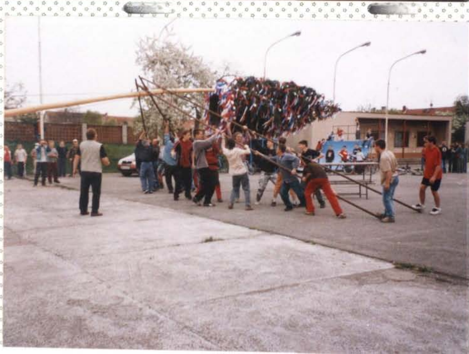
Připrava a stavení nádrže, uchycení podpěr a jejich posun, střední nádrže