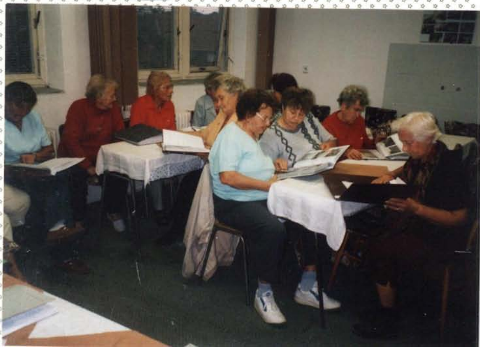
Obecní kronikář sekce přítomné s historií kronice a předvedl obecní kroniky od roku 1999 do současnosti

Klub důchodců, odpoledne při kávě, prohlídka obecních kronik účast 18 důchodkyň