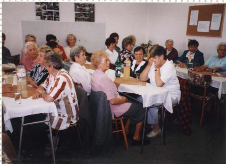
11.5.2006 pokračují oslavý Den matek v klubu důchodců