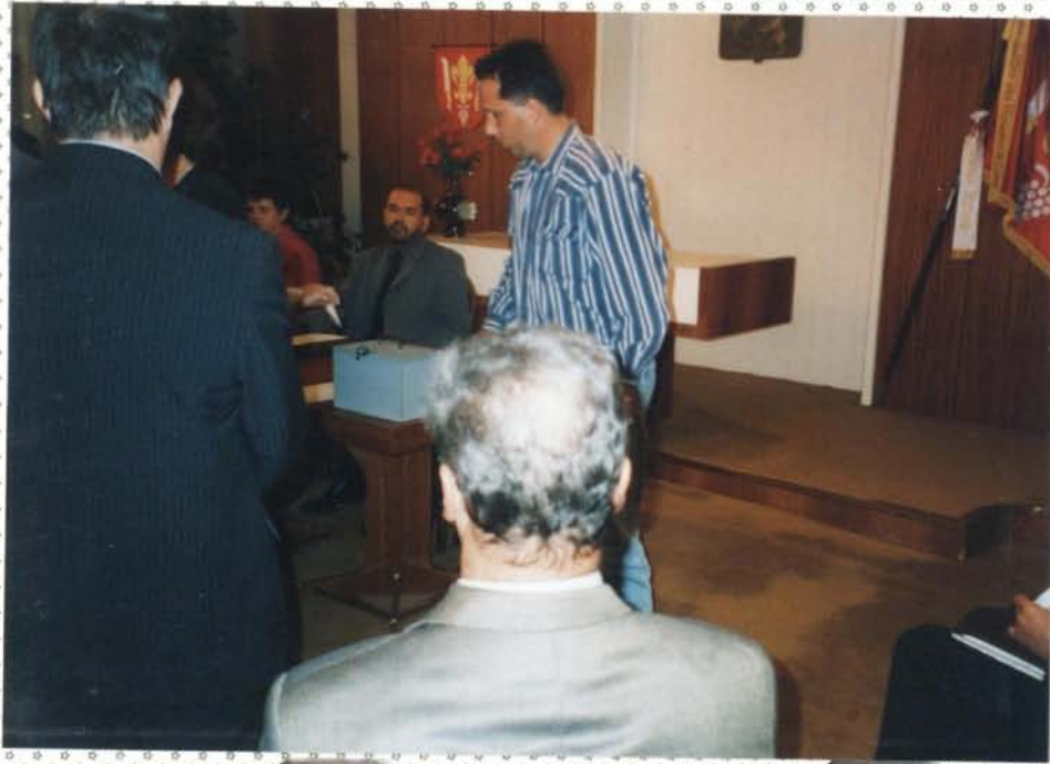
Volba předsedy finančního a kontrolního výboru