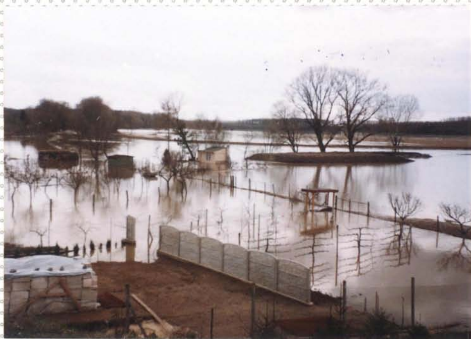
Zaplavená krajina z řeky Tiblatky