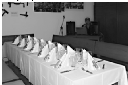
Slavnostně prostřená tabule

Kromě široké nabídky občerstvení nabízí též turistům kvalitní informační servis, pohlednice a odznaky Vranovic, mapky a turistické průvodce. „Turisté většinou chtějí mapy, naše dědina je takovým výchozím bodem, zaparkují a vyndají kola, posílí se na cestu a mají možnost výběru z několika cyklotras. Několikrát jsem jim na internetu vyhledávala ubytování, stravování a zjišťovala nejbližší akce,“ svěřuje se paní Ivana.