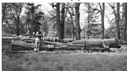
Putování za pokladem.

Někteří z vás si již povšimli, že se ve Vranovicích v nedávné době objevilo nové volnočasové uskupení, které si říká Vraníci. Sdružuje děti ve věku od 5 do 100 let, které neztratily chuť hrát si. Uskutečnilo již dva výlety a další připravuje. Zakladatelem i neoficiálním vedoucím tohoto zájmového sdružení je Milan Novák z Příbrami, který se aktivitám s dětmi věnuje již 30 let.