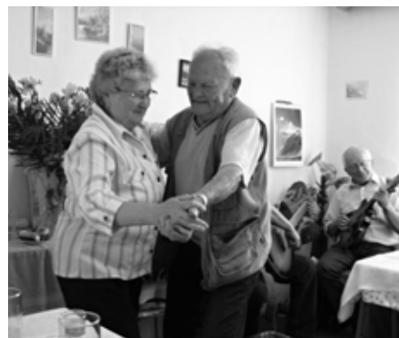
Přišlo i na taneček