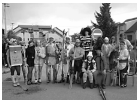
Společné foto účastníků recesistického závodu v běhu na lyžích.

I přes nepříznivé počasí přišlo běžkaře podpořit početné publikum. Pro vítěze byl připraven pohár a tričko s motivem závodu. Nechyběla ani medaile pro první tři závodníky s nejlepšími časy.