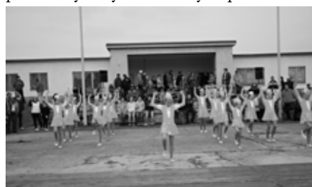
Mažoretky z Pohořelic předvedly své vystoupení

Jídlo vystřídalo kulturní odpoledne, kdy návštěvníky přijel bavit Železný Zekon. Nejen síla, ale i široký úsměv a nezastavitelná vyřídilka k němu přitáhly snad všechny, co na Vranovické jaro dorazili, a vytvořily mu mocné publikum, před kterým byla radost vystupovat.