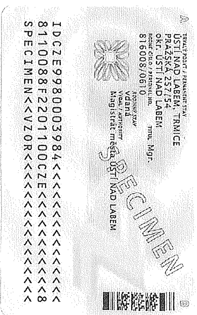
Zadní strana (bez čipu)