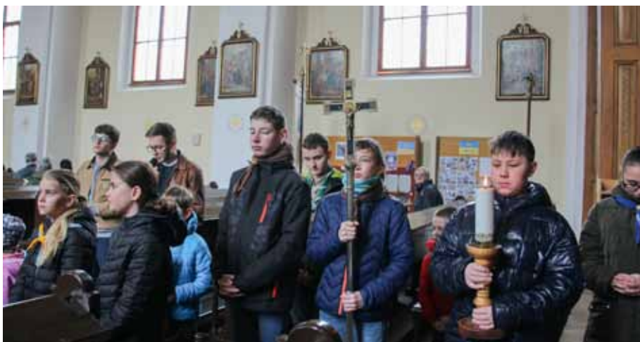
Skautská křížová cesta