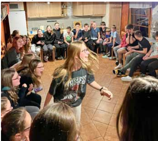
Zimní výcvikový kurz ZŠ Vranovice

Onoho odpoledne 25. února jsme se školou vydali na pětidenní zimní výcvikový kurz do Kunčic. Společně s dobrou náladou celého kolektivu byla atmosféra samotné cesty autobusem velmi zábavná a obzvláštnili jsme ji veselou hudbou. Na chatě U Profesora na nás už čekali nevídané pokoje, bazén, herna na ping pong, a dokonce i sauna.