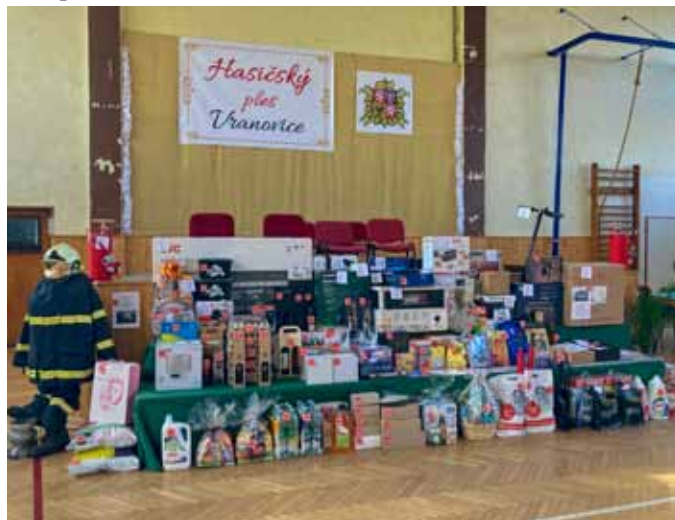
Letošní bohatá tombola

V předsáli byla po celý večer skvěle fungující parta barmanů za barem, která nabízela víno, pivo, limo, kávičku i panáčky, dobroty – hasičské jednohubky, brambůrky..., v kuchyni šéfkuchař připravoval vynikající bramborový salát a vepřový řízek. Šatnářka a šatnář se pěkně postarali o kabáty dam a bundy, saka pánů.