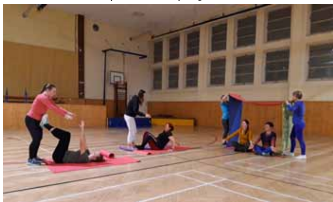
Nácvik sletové skladby

Ze skladby, která je rozdělena do IV. oddílů, umíme již dva. Z III. oddílu nám chybí doučit se jen pár taktů.