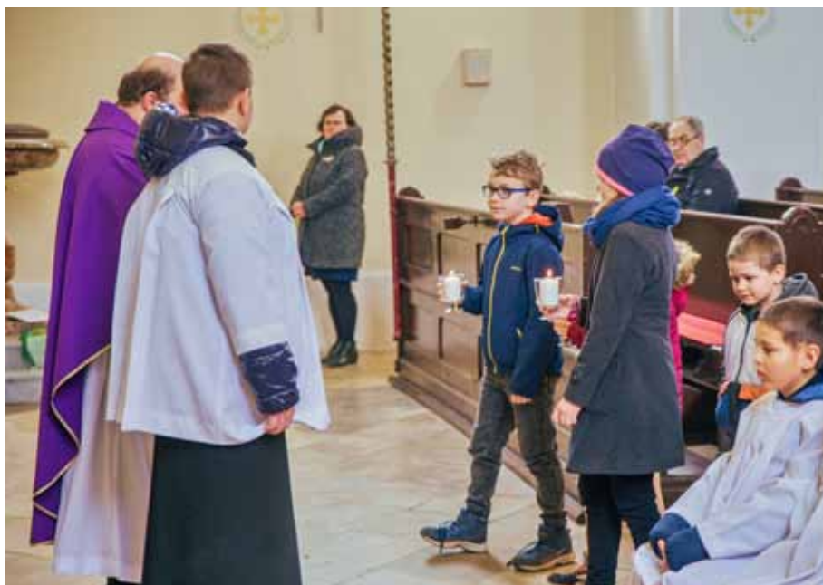
Autor: A. Kukleta

Účast na křížové cestě, která se pravidelně v naší farnosti koná každou neděli v rámci postní doby, poskytuje věřícím další možnost pro hlubší odevzdání se duchovnímu životu a ztišení mysli. Pro věřící je to cesta, která symbolizuje Kristovo utrpení a oběť, a připomíná jim důležitost pokání a odpuštění. Společné putování křížovou cestou je pro každého věřícího inspirativní návod, jak se přiblížit k Bohu pomocí oběti a služby druhým a připravit se na slavnost Vzkříšení Páně. Nově mají možnost se věřící zapojit do modliteb křížové cesty v našem Vranovickém kostele od 9 hodin každou neděli postní před mší svatou. Je to drobná změna, která má za úkol přivést na křížovou cestu i lidi, co mají obvykle