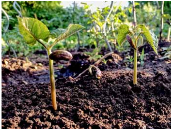
Fazol svatá trojice

druhů rajčat, salát, pár druhů bylin, hrách, fazol... Nechybělo ani několik méně tradičních plodin, jako třeba chilli papričky, exotické ovoce kiwano či lufa, která se usušená používá jako houbička.