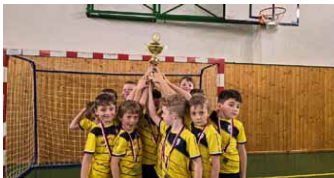
Mladší příprava, vítěz ZHL

Ani v zimním období aktivita našich mladých fotbalistů nepolevuje a dle známého trenérského pořekadla „co natrénuješ v zimní přípravě, z toho těžíš celý rok“, jsme poctivě trénovali. Zimní příprava naší fotbalové mládeže probíhala už druhým rokem v hale v Přibicích vždy v úterý a ve čtvrtek. Za příznivého počasí jsme tréninky doplnili ještě o venkovní tréninkovou jednotku vždy v neděli dopoledne na naší nové umělé a novém atletickém oválu.