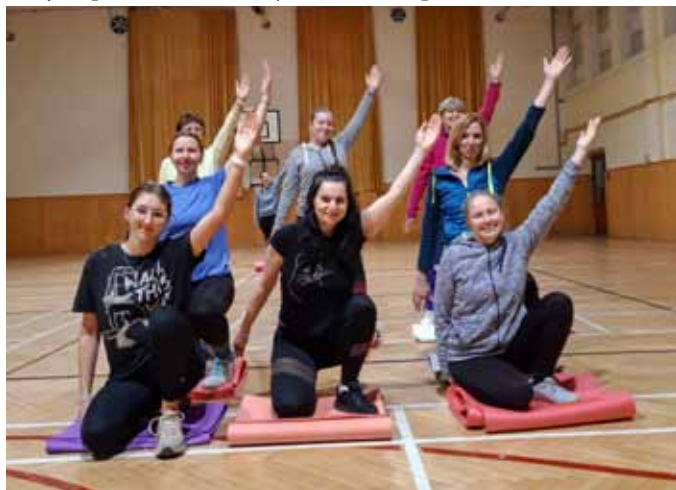
Mladší ženy a dorostenky

Čeká nás tedy závěrečný oddíl, který je náročný z hlediska přesunu na ploše. Choreografie je řešena pro hromadné vystoupení v Praze a Brně. Některé obrazce vytváří až 64 cvičenek a nás je pouze 15. Zbývající „značky“ jsou prázdné a my se pak těžko orientujeme, kam se postavit.