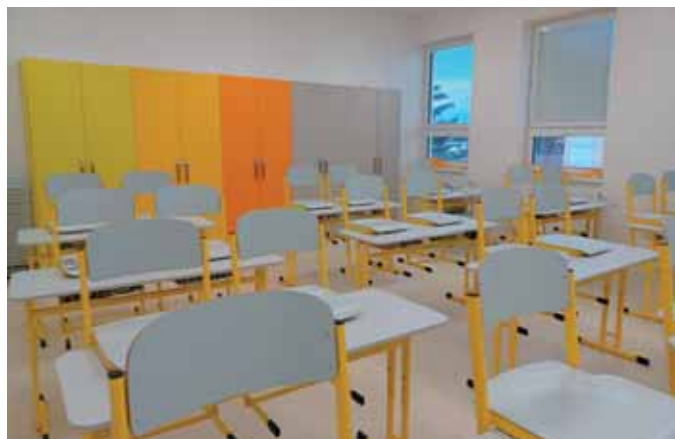
Úplně sluníčková třída

Součástí tříd jsou i moderní interaktivní tabule, které nabízejí spoustu zajímavých a zábavných výukových možností. Výuka v této části budovy probíhá už druhý týden. V současné době se žáci v nových prostorách zabývají a celé patro si zútulňují a zdobí. S tím jim už brzy pomůžou také speciální nástěnkové tabule, na které si budou děti moci vystavit své obrázky z hodin výtvarné výchovy.