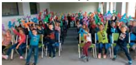
Žádné dítě neodešlo s prázdnou

Můžeme říct, že jsme se i trošičku báli, a to tehdy, když si vybral naši paní vychovatelku a začal jí svazovat provazem. Všechno dobře dopadlo, vždyť to byl kouzelník. Nakonec nás seznámil se svou malou kamarádkou. No, byla trošičku popleta, ale nám se moc líbila, smáli jsme se, až jsme se za břicha popadali.