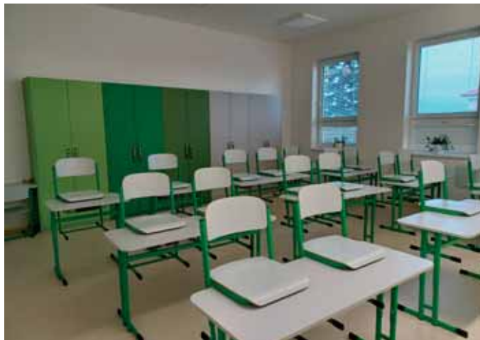
Třídy jsou odlišeny barevným nábytkem

Usídlily se tu tři třídy prvního stupně, a to 4. A, 4. B a 5. A. Podle barev nábytku děti říkají, že obsadily „zelenou“ učebnu (4. A s paní učitelkou Sedláčkovou), „žlutou“ učebnu (5. A s paní učitelkou Nečasovou) a „modrou“ učebnu (4. B s paní učitelkou Střelcovou). I přes to, že cesta do tohoto patra znamená zdolat nějaké to schodiště, děti se této rozcvičkové výzvě každé ráno s nadšením postaví.