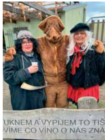
Medvěd s doprovodem

Vranovické baby společně s Vinotěkou pro všechny připravily krásné prostředí, nechyběla skvělá muzika a samozřejmě tanec. V nabídce byly zabijačkové speciality jako jitrnice, jelita, tlačěnka i polévka. Na zahřátí nechyběl čaj pro děti, svařák pro dospělé. K masopustu patří také tradiční koblížky i boží milosti, na kterých si mohl každý pochutnat. Počasí vyšlo, a proto zábava trvala až do večerních hodin.