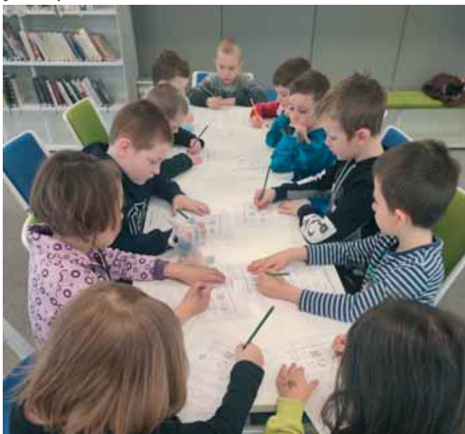
Hrajeme si na spisovatele

Hned další týden, se knihovnou ozýval hlas dětí z Mateřské školky. Přišly se seznámit s knihovnou, povídaly jsme si o tom, jak kniha vzniká, nebo co kde v knihovně najdou. Přečetly jsme pohádku o skřítcích, kteří pomáhají paní knihovnici a děti si i prohlédly pár knížek, každou návštěvu jsme se nakonec ještě protáhly s básničkou.