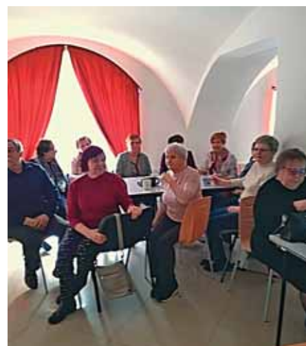
Přednáška přinesla spoustu nových poznatků