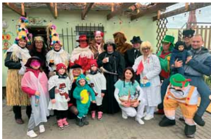
Masopustní veselí na Vinotěce