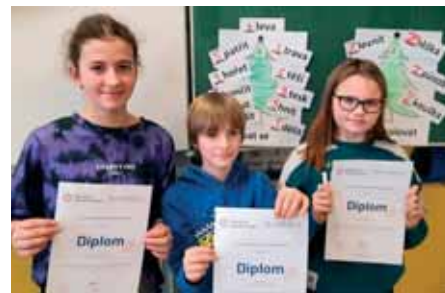
Vranovický tým okresního kola

V letošním školním roce si žáci 5. ročníku vyzkoušeli svoje schopnosti a dovednosti v oblasti finanční gramotnosti. V základním školním kole si nikdo nevedl špatně, i když někteří si museli pomoci tipováním. Každý soutěžil sám za sebe, a protože soutěž probíhala online, hned se věděl výsledek. Otázky ovšem byly na věkovou úroveň dětí opravdu těžké a určitě by je s jistotou nezodpověděl i mnohý dospělý.