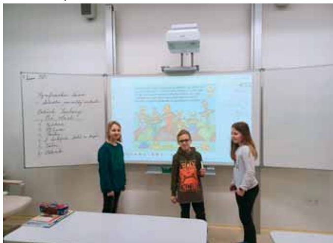
V nových třídách půjde učení samo

Kdo v posledním půl roce procházel kolem budovy základní školy na Masarykově ulici, musel si všimnout probíhajících stavebních úprav a přístavby. Z původní staré školní pudy v druhém nadzemním podlaží totiž vznikly během minulého pololetí nové atraktivní školní prostory nejen s učebnami, ale i s prostornou širokou chodbou, dvěma kabinety a sociálním zařízením pro žáky i učitele. Všechny prostory jsou, jak to v novostavbách bývá, moderní, pěkné, čisté a stylově zařízené. O přestávkách se žáci můžou pokochat pohledem na kostel, ke kterému jsou otočená okna.