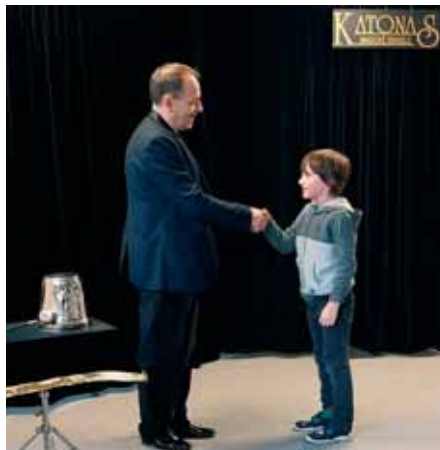
Malý budoucí kouzelník?

Učil nás kouzlit hůlkou, asistovat při kouzlení s barevnými šátky. Dokonce přinesl i stříbrné kruhy, které různě proplétal za asistence naší kamarádky.