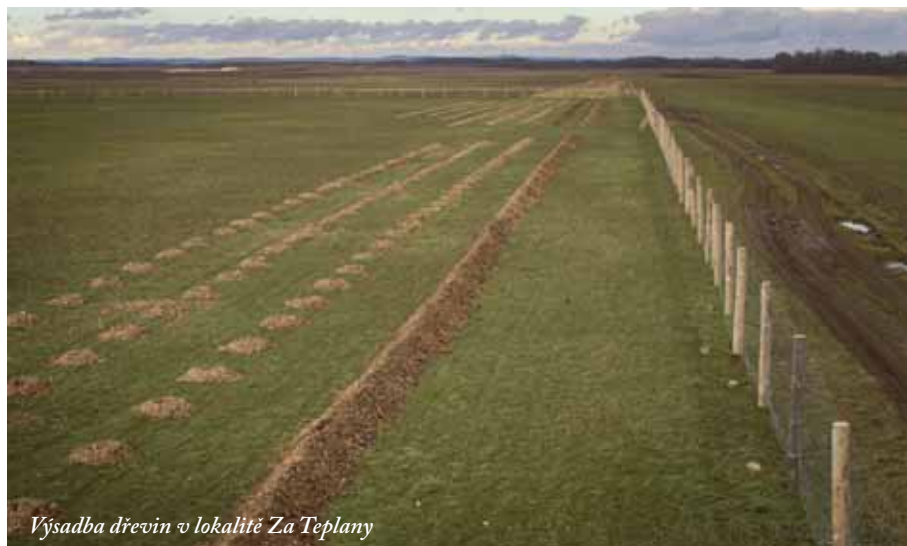
Výsadba dřevin v lokalitě Za Teplany