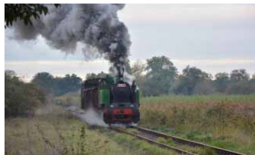
Zvláštní vlečkový vlak v blízkosti bývalé zastávky Velký Dvůr

Osm kilometrů dlouhou trať, od jejíhož otevření uplynulo letošního 17. září již 120 let, zdolal mimořádný vlak přibližně za dvě hodiny. V průběhu jízdy totiž na mnoha místech proběhly tzv. fotozastávky s opakovanými rozjezdy a průjezdy pro účastníky jízdy, kteří si vše pečlivě fotografovali a natáčeli do svých archivů. Řidičům na blízkých silnicích u Velkého Dvora, Příbic a Vranovic se tak naskytl neobvyklý pohled. Od Pohořelic se za hlasitého pískání blíží parní lokomotiva, která vypadá spíše jako pohádková mašinka, se třemi vagóny. Najednou vlak zastaví, z posledního vozu rychle vystoupí 20 lidí ověšených fotoaparáty a kamerami a zatímco lokomotiva tlačí vozy pár desítek metrů zpět, fotografové zaujmají pozice, odkud pořídí nejlepší snímky. Vlak se rozjíždí směrem k nim, lokomotiva vyfukuje oblaka páry a dýmu, závěrky cvakají. Vlak zastaví, fotografové spěšně nastupují do posledního vozu a jede se dál, na další vytipované fotomísto. Nezasvěcení si klepou prstem