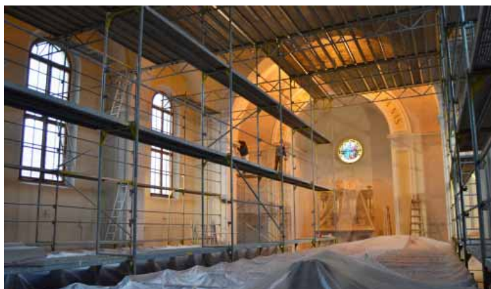
Mohutná konstrukce lešení zaplnila vnitřek kostela