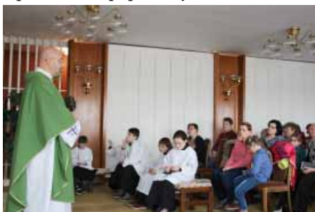
Po dobu malování kostela se bohoslužby konají ve velké obřadní síni obecního úřadu

Vnitřek kostela zaplnila mohutná konstrukce lešení, byly provedeny zednické práce na opravách vlhkem poškozených stěn, uvnitř chrámu byly do stěn zapraveny elektrorozvody a následně se započalo s celkovou výmalbou interiéru. Rekonstrukce se také dočkají některé malby na stropě, které v průběhu let popraskaly.