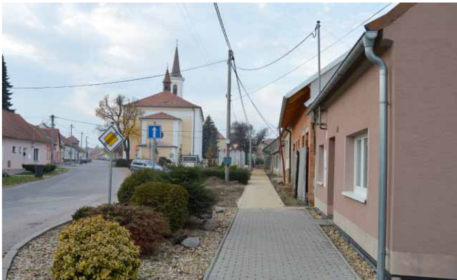
Nové chodníky se zámkovou dlažbou dostaly ulice Dlouhá a Školní