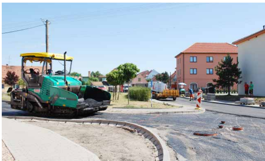
K největším investičním akcím letošního roku patřilo řešení dopravní situace a celkové zklidnění dopravy v centru obce v podobě „Zóny 30“.